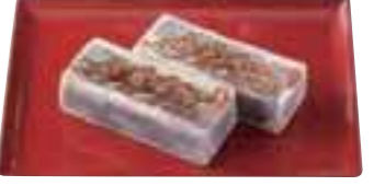
江戸城築城の石に見立てた「御石曳」。