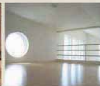
絶対必要！屋根裏収納