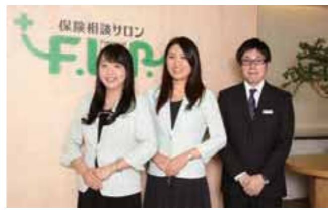
経験豊富なスタッフが丁寧に。昨年決められなかった保険の悩みはココへ!