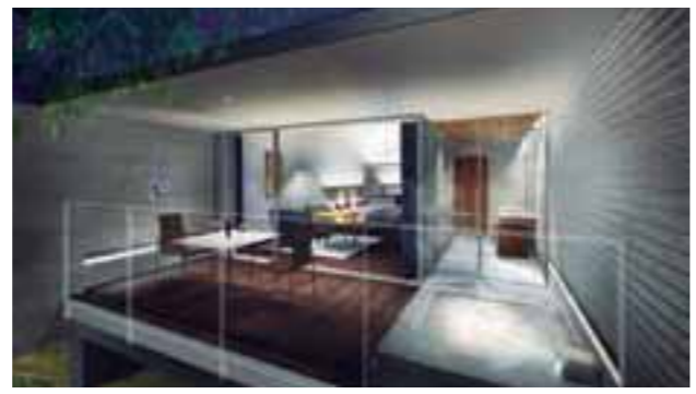
温泉露天風呂付ツイン 全8室(禁煙)