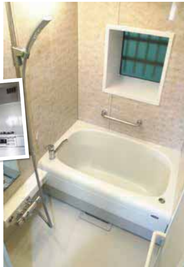
清潔感あふれるバスルーム。シャワーや手すりの設置も邪魔にならない設計。