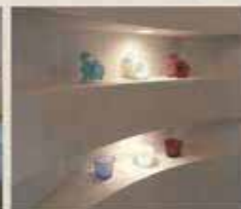
ワンポイントのニッチ