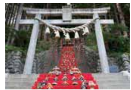
素盞鳴神社雛段飾り。写真はイメージ。