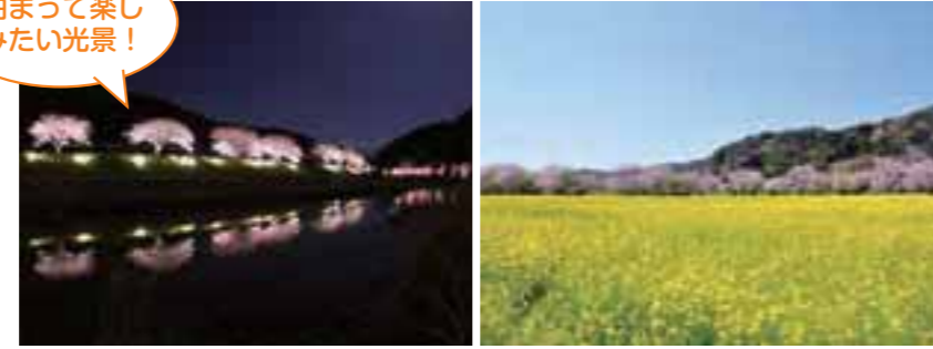
桜の花色と菜の花の黄色のコントラストが美しい(上・下右)。泊りて楽しむお花見も最高(下左)。