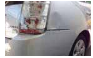
キズがついたらまずは見積もりを！

ミスマ特典 Tカードのポイントが2倍 他の割引との併用不可。現金払いのみ。本誌持参の方。 【2014年3月31日迄有効】