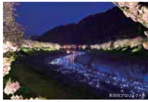
川沿いに広がる幻想的な光景。

夜桜と「いのり星」の競演。いのり星は、着水すると点灯するLEDを光源とした光の球で、再生可能エネルギーの利用で環境負荷の少ない演出を実現。夜空に瞬く星に見立てて川へと放流される。3/3(月)～9(日)18時～20時。