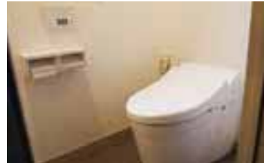
すっきりとスペースを確保したトイレ。手入れも簡単。