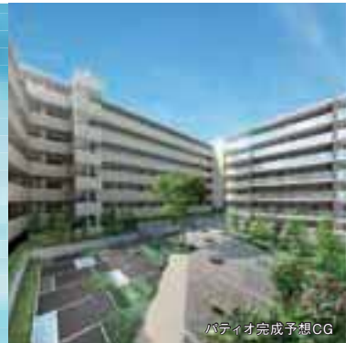
パティオ完成予想CG