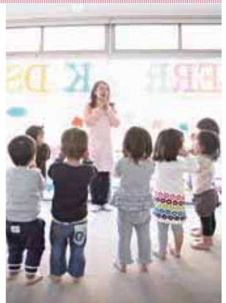
川崎認定保育園としての機能も果たす本園は、近年、働くママの頼もしい味方に。