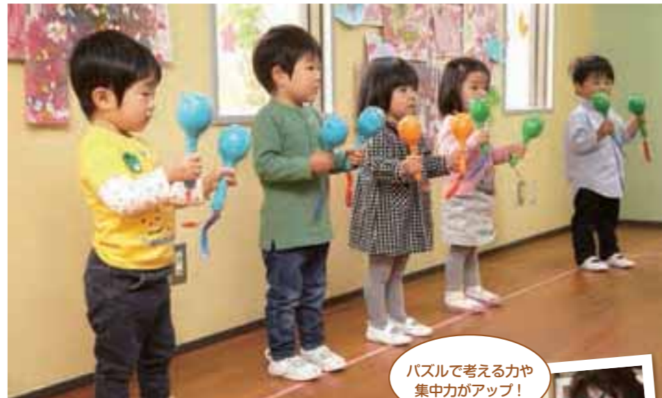
音楽活動を通して、音感やリズム感、表現力を育む。