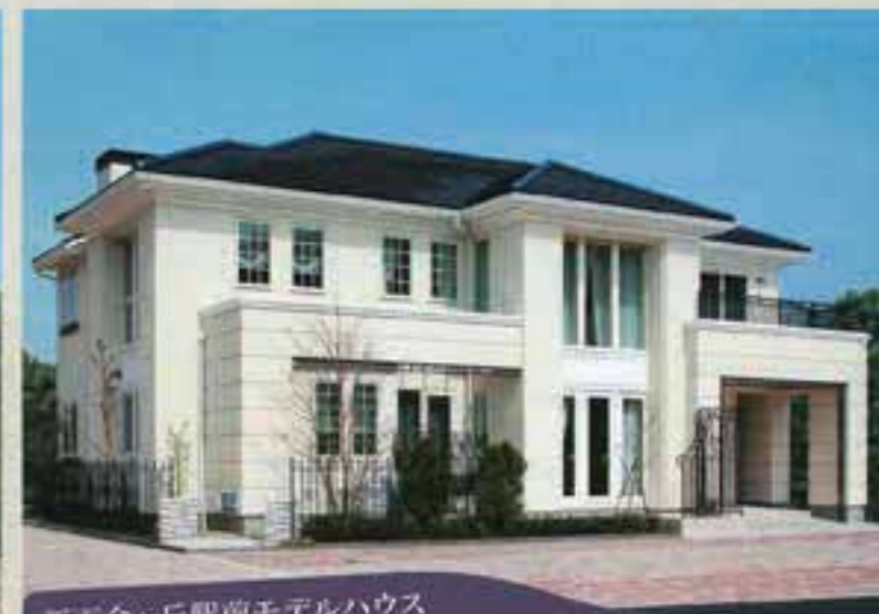
新百合ヶ丘駅前モデルハウス パリ風デザイン 完全分離の二世帯住宅