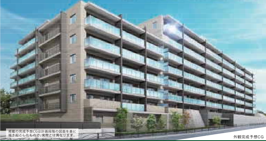
掲載の完成予想CGは計画段階の図面を基に描き起こしたもので、実際とは異なります。