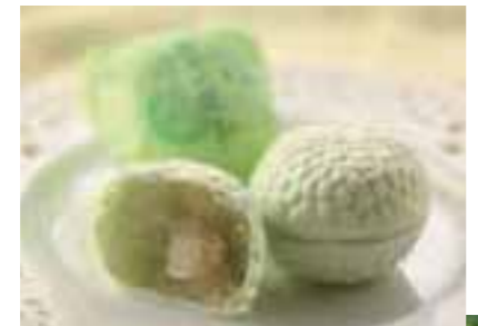
南伊豆のお土産に人気のメロン最中(上)。大正時代から始まった温泉熱を利用したメロン栽培(右)。

メロン栽培が盛んな南伊豆町を代表する、60年近く愛され続けている銘菓。サクッとした皮の中から、メロンの風味豊かな白餡が現れる。