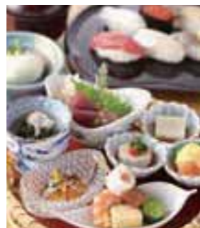
人気ランチ「花かご膳」は前日予約がおすすめ！

本格フレンチを提供する本館では、「新百合ヶ丘物語 煌(かがやき)」がおすすめ。アミューズ・お造り・季節のスープ・煮物・和牛料理・鉢物・鮨・お椀・デザートまで付いた豪華コース。本館と別館では異なる料理、雰囲気味わえるので、用途や気分に合わせてそれぞれ楽しみたい。