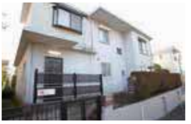
麻生区で初めての「放課後等デイサービス」。