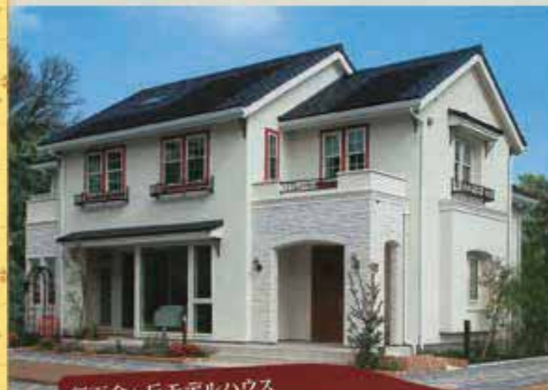
新百合ヶ丘モデルハウス “あったらいいな”を叶える女性視点の住宅