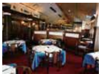
和と洋が融合し優雅な雰囲気を演出する本館。