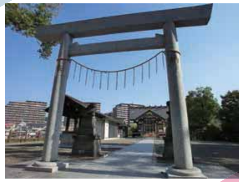
マンション群の中に再建された十二神社。街中でありながら、厳かな雰囲気。