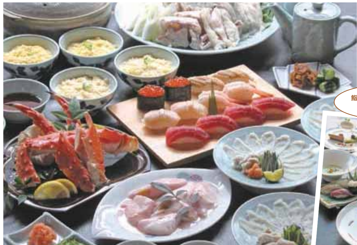
鮨も肉料理も楽しめる「煌」は本館限定