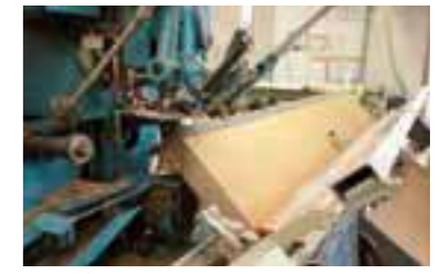
畳とイグサを知り尽くした畳作り。