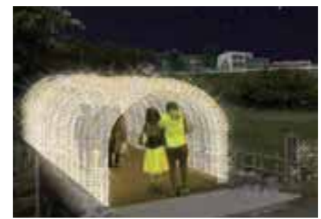
文化公園イルミネーション「プリンセスロード」。写真はイメージ。

今年は新しいイベントが二つ誕生。まつり期間中の19時～21時30分、稲取文化公園全体にイルミネーションが施され、光り輝く公園に変身する。また、1617年創建といわれる素盞鳴神社の階段には、海を見守る雛として、雛人形と雛のつるし飾りが展示される。2/2(日)～16(日)10時30分～15時(予定)。