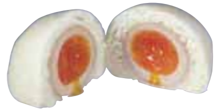
半熟卵が入ったもちもちの「たままん」。

数ある名物の中でも珍しいのは、稲取高原の採れたて玉子を半熟にして、生地くるんだ「たままん」。また、伊豆産の江戸城築城石に見立てたきんつば「御石曳」も、歴史を背景にした話題の菓子。どちらもお土産にしたい。