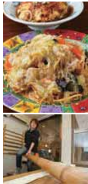
優しい味わいの手打ちラーメン(左)。あんかけ焼きそばと天津丼(右上)。竹を使った麺の手打ちは店内で見ることができる(右下)。