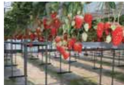
おいしく楽しいいちご狩り。