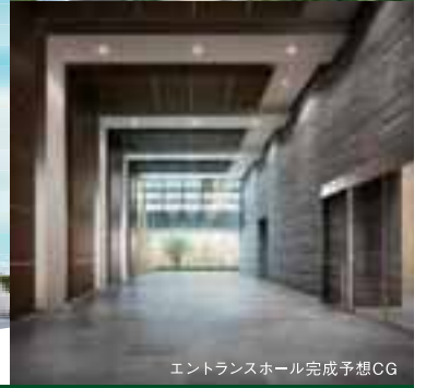
エントランスホール完成予想CG