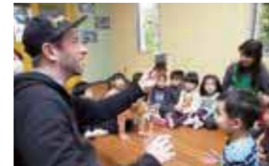
外国人講師による楽しいリズム・イングリッシュ。

ミニモ特典 入会金特別料金 通常21,000円~5,250円。本誌持参の方。 【2014年2月28日迄有効】