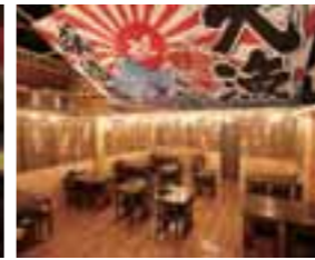
「こぼれげた寿し」2,940円(上)。「天ぷら地魚定食」1,869円(下左)。大漁旗が印象的な店内(下右)。