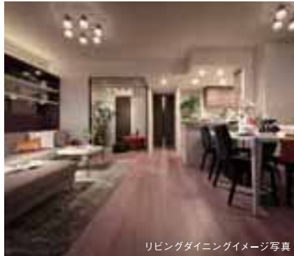
リビングダイニングイメージ写真