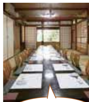
別館にはゆっくり過ごせる個室や座敷も

カウンター、握りこたつ式・テーブル式の個室、座敷を完備している別館。握りたての鮨を堪能できるカウンターコース6,300円～、おもてなしコース3,990円～、握り・ちらしなどお得なランチメニュー1,260円～も別館ならではの。