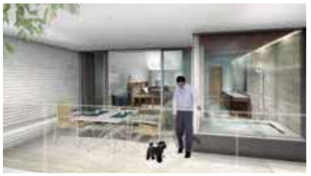
ドッグフレンドリールーム 全7室(禁煙)