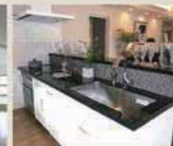
重厚感あるキッチン