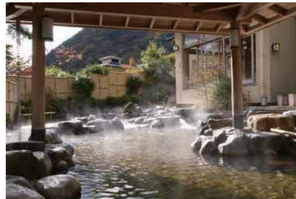
裸入浴の森の湯。横になれるお休み処も(上)。椿風呂が登場。写真はイメージ(下左)。ユネッサン初登場のマルコメ君風呂(下右)。