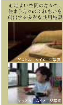
心地よい空間のなかで、住まう方々のふれあいを創出する多彩な共用施設