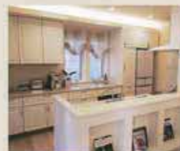
エレガントなキッチン