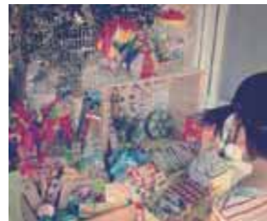
子どもが喜ぶ「駄菓子屋チッタ」。