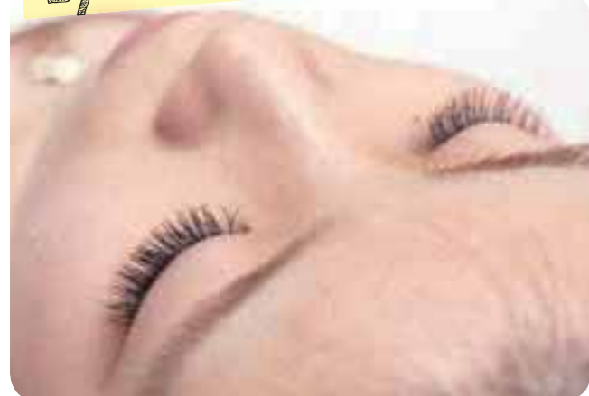
丁寧なカウンセリングでナチュラルな目元に。肌に優しい良質グルーを使用。

初回限定特別メニュー 新規の方。右記メニュー参照。 【2014年10月31日迄有効】