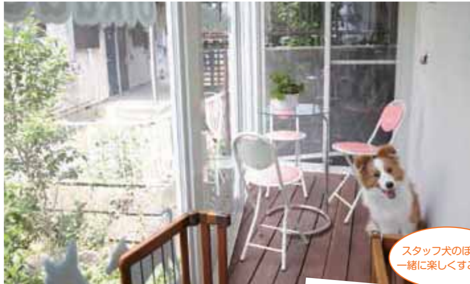
まるで自分の家にいるような居心地のよさに、愛犬もすっかりリラックス。