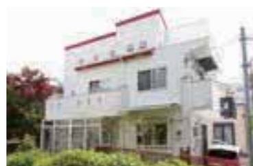
一戸建てで親しみやすい雰囲気の犬家保育堂。