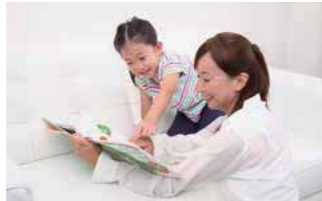
子どもたちの個性を大事に、保護者の気持ちも理解してくれるうれしいサポート。