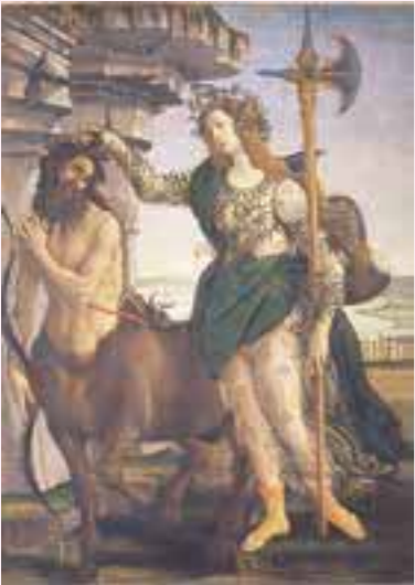
サンドロ・ボッティチェリ (バラスとケンタウロス) 1480-85年 テンペラ、カンヴァス ウフィツィ美術館

箱根小涌園ユネッサン 0460-82-4126 http://www.yunessun.com/