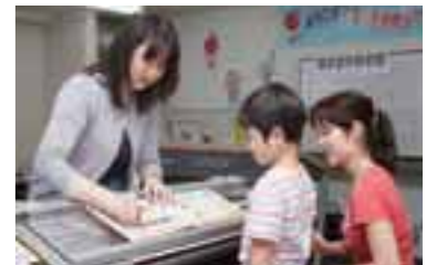
親子で受けるレッスンも！リラックスして学べる。