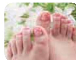
可愛い足元で楽しくおでかけ(左)。リラックスできる落ち着いた店内(右)。