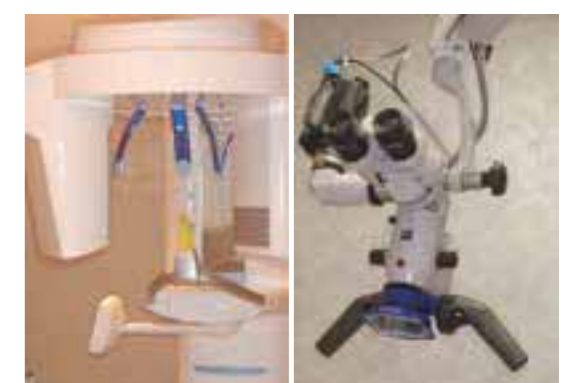
歯科用CT 歯科用マイクロスコープ

その大切な歯を守るために、特に症状がなくても定期的な検査を受けることをおすすめします。歯を失ってしまう要因の一つが、初期段階での自覚症状が少ない歯周病だからです。歯周病は、歯と歯肉の境目(歯周ポケット)に細菌が入って引き起こされる感染症で、進行がはやいため多くの歯を失ってしまう方もいらっしゃいます。そうならないために、当院では、患者様ごとに担当の歯科衛生士がつき、普段のお手入れ方法を含めしっかりサポートします。口腔内でお困りの症状がある場合はその改善方法をご案内いたします。