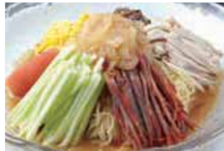
旨みとコクあるスープがやみつきに(右)。レモンが香るコマだれが美味(左)。

8/31(日)まで、1,250円のふかひれ麺が1,000円に。椎茸でだしをとったスープは甘味とコクが抜群で、たっぷりのふかひれと蟹肉、きのこ、ネギの出合いは感動的な味わい。コラーゲンが豊富なので、女性にも好評。食欲をわかせる涼しい冷やし中華もおすすめだ。