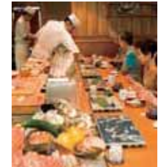
別館のカウンター席では、職人との会話も楽しめる。