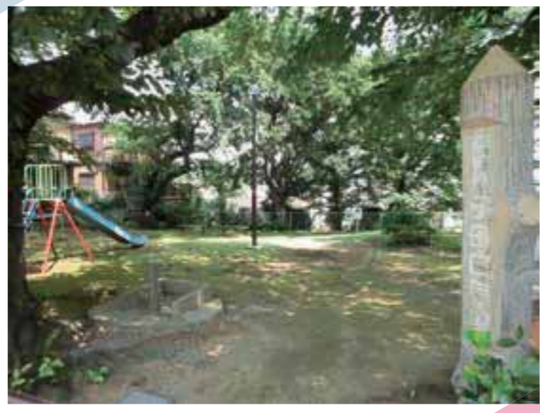
縄文人が食べたハマグリ、貝殻や、スズキ、クロダイなどの骨が見つかった川崎市高津区の子母口貝塚。