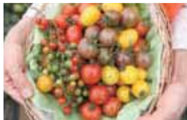
彩り豊かなトマトなど、朝どれの野菜が味わえる。