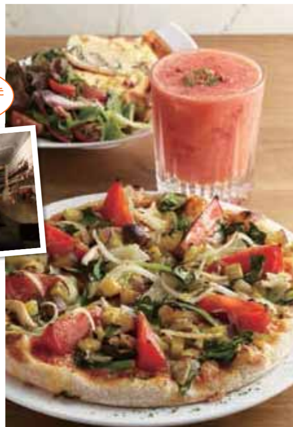
自家農園野菜を使った料理と、季節のフレッシュフルーツカクテルが人気。

ミスモ特典 ファーストドリンクプレゼント 日・祝限定。「本誌を見た」と前日までに食事予約をされた方。【2014年10月31日迄有効】