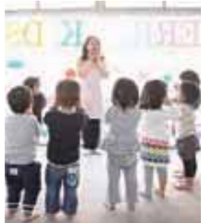
シャワーのように英語を浴びるレッスン。

園説明会を9/20(土)、10/11(土)各13時30分から開催し、保育方針やカリキュラムなどを詳しく紹介する(要予約)。子どもたちの個性を伸ばし、社会性を育み、「積極性を身につけた国際人」を養うレッスンで、自ら表現する喜びを学んでいく。気軽にお問い合わせを。