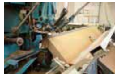
畳とイグサを知り尽くした畳作り。