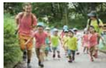
駅近で公園隣接。恵まれた環境も魅力。

いつも元気いっぱい! 笑顔あふれる園内。9月生と2015年4月生の見学受け付け。