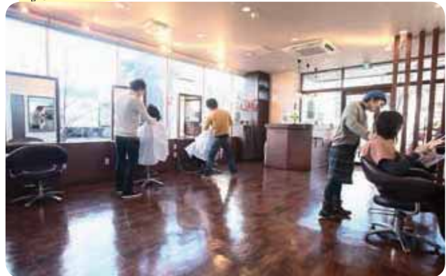
丁寧なカウンセリングも好評。トレンドを意識したスタイルをご提案！