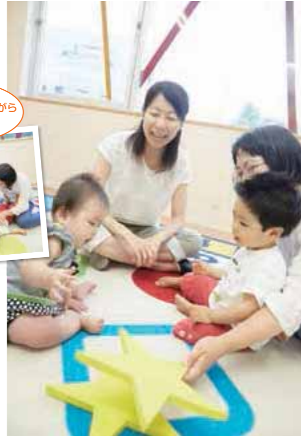
明るい雰囲気の新ゆりセンターは、新百合ヶ丘駅南口から徒歩3分と便利。