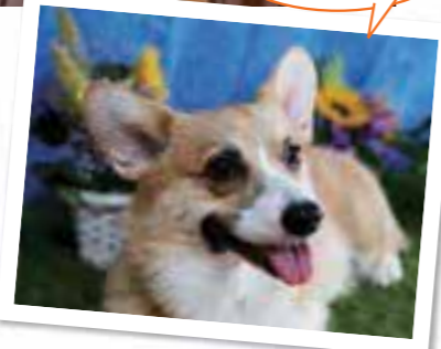
スタッフ犬のほくと一緒に楽しくすごそう