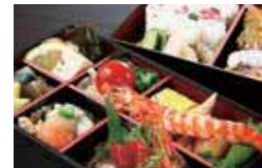
「玉手箱弁当折箱」は配達もOK。料亭の味を家庭でも。

敬老の日や七五三のお祝いは、本格京懐石が楽しめる有吉で。旬の食材を生かした、季節感満載の「お祝い弁当」(5,700円+税)や「玉手箱弁当折箱」(2,710円+税)は、記念の集まりにぴったり。見た目も繊細で美しく、華やかさもあって、幅広い世代に人気だ。落ち着いた雰囲気の内には、カウンター席とお座敷を用意。小上がり風の座敷は、お祝い事の席に利用されることが多い。