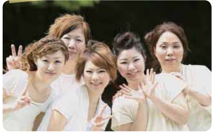
アットホームな雰囲気と明るいスタッフが子どもの緊張をほくしてくれる。