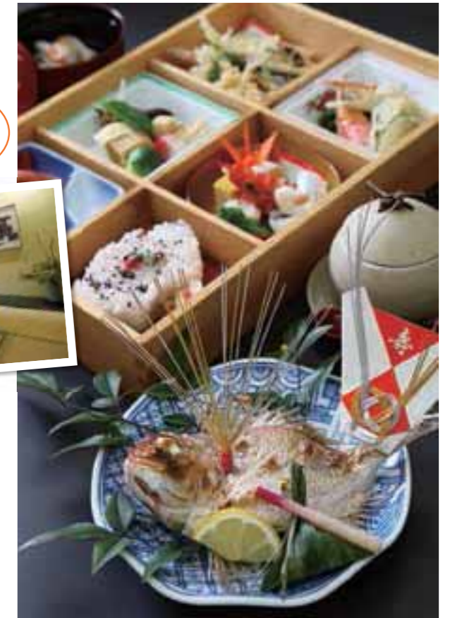
記念の宴には、旬の野菜や食材をふんだんに盛り込んだ「お祝い弁当」。