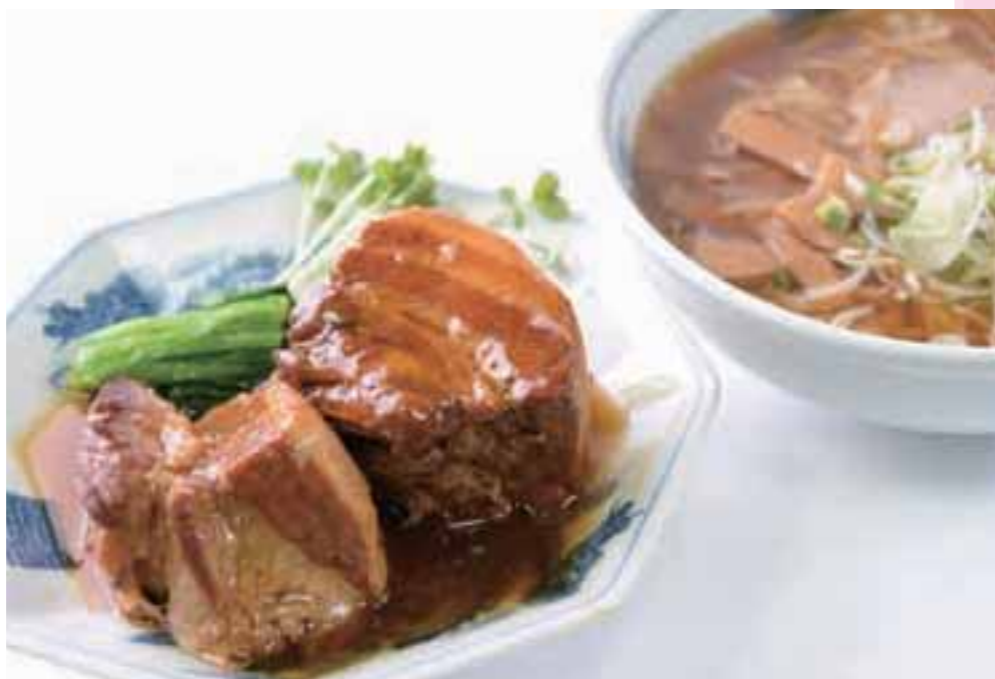
食べ応え抜群の角煮を載せて楽しむ角煮ラーメン(上)。名物アゲワタタン700円(下左)。麺の手打ちは店内で見られる(下右)。

ラーメンとは別に大きな角煮二切れが添えられた角煮ラーメンは、隠れメニューとして大人気。創業以来守り続けている秘伝のあっさりとした醤油スープと相性抜群だ。ボリューム満点の角煮は同伴の仲間とシェアするもよし。職人が青竹で打つ手打ち麺が評判の同店は一品料理やアルコールメニューも豊富で、夜は老舗ならではのレトロなにぎわいが魅力的。2階の座敷は大人数の利用もできる。