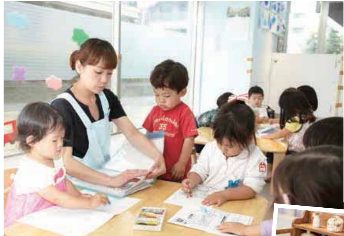
自由な発想を生かし、英語やアートを楽しく学ぶ。