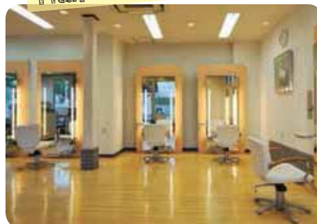
明るく開放感たっぷりの空間で、丁寧な施術に身を任せたい。

30%OFF 新規の方。4,000円以上の施術をされた方。 【2014年10月31日迄有効】