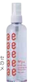
2013年モンドセレクション受賞の「電子トリートメント」も販売中。