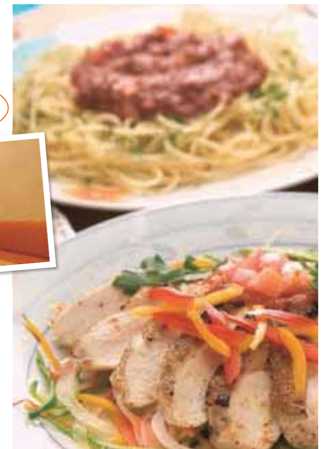
料理メニューが充実! 大皿プレートもあるので少人数から団体までOK!