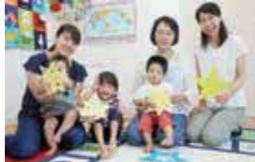
写真タイムもあり！季節に合わせたクラフトを制作。

ママと一緒に体を動かしたり、音楽を聞いたりしながら、0歳から英語を学ぶ「えいご☆デビュー」が、新ゆりセンターと百合丘センターで10月から開講。3月までの6カ月短期間レッスンで、季節のイベントを親子や友達と楽しみながら、自然に英語に親しむ。プロの日本人講師が、リズムに合わせて英語が好きになる環境をつくってくれるので安心。1クラス8組までのグループレッスン。詳細はHPを。