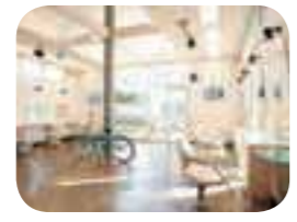
広々として明るい店内(左)。七五三の思い出づくりに。ヘアメイク、着付け、撮影まで対応(右)。