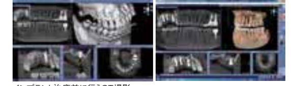
インプラント治療前に行うCT撮影

歯周病が進行してしまい、残念ながら歯を失ってしまった場合、「オール・オン・フォー」というインプラント