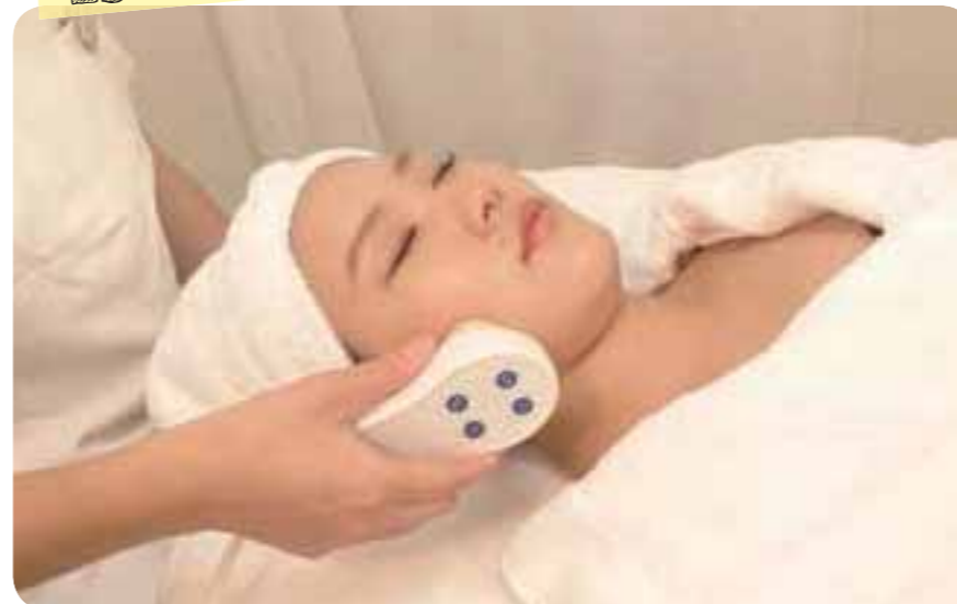
夏の疲れた肌にはシミ美白ケアを。背中や頭皮をケアしてくれるので大満足。