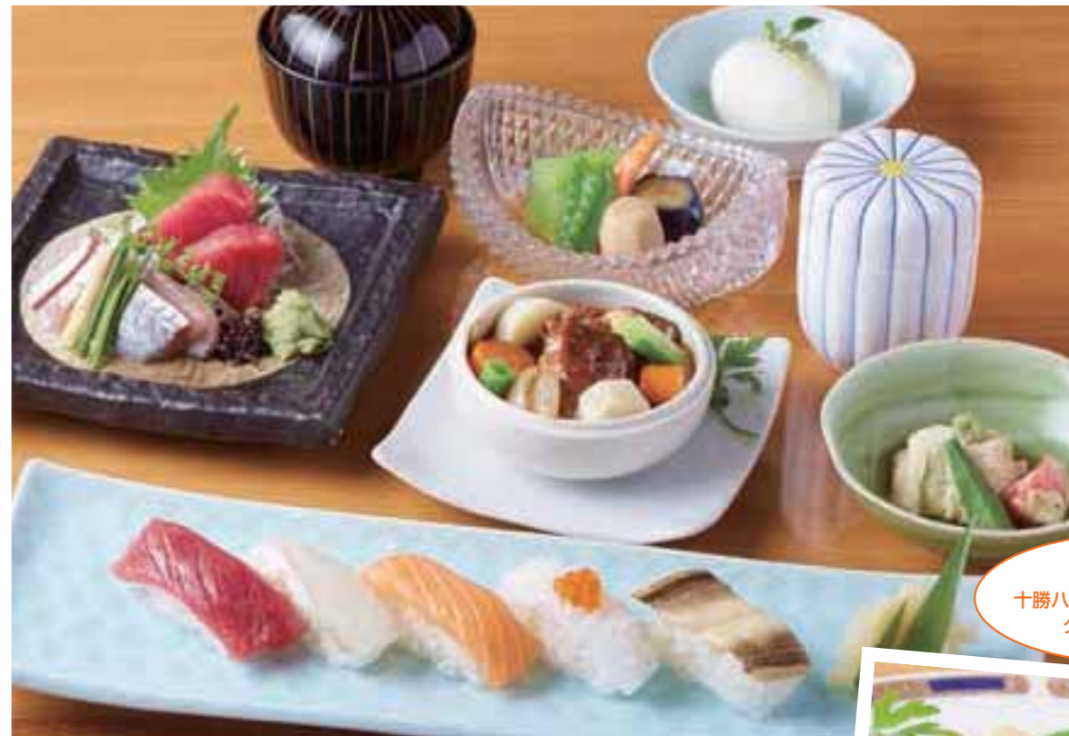
寿司も十勝ハープ牛シチューも、たっぷり堪能できる「暑涼コース」2,500円+税。

スで、昼でも夜でも会話が弾むこと間違いなし。さらに十勝ハープ牛ステーキなどこだわり食材にグレードアップも! 本館別館それぞれの、特色あるお得なランチメニューもおすすめ。七五三を祝う食事会の予約も受付中。大切な人たちとの集いを旭鮨にて催してみたいかが。