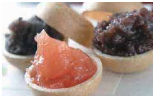
柿生の名物、麻生 柿の里最中。お土産にもぜひ(左)。