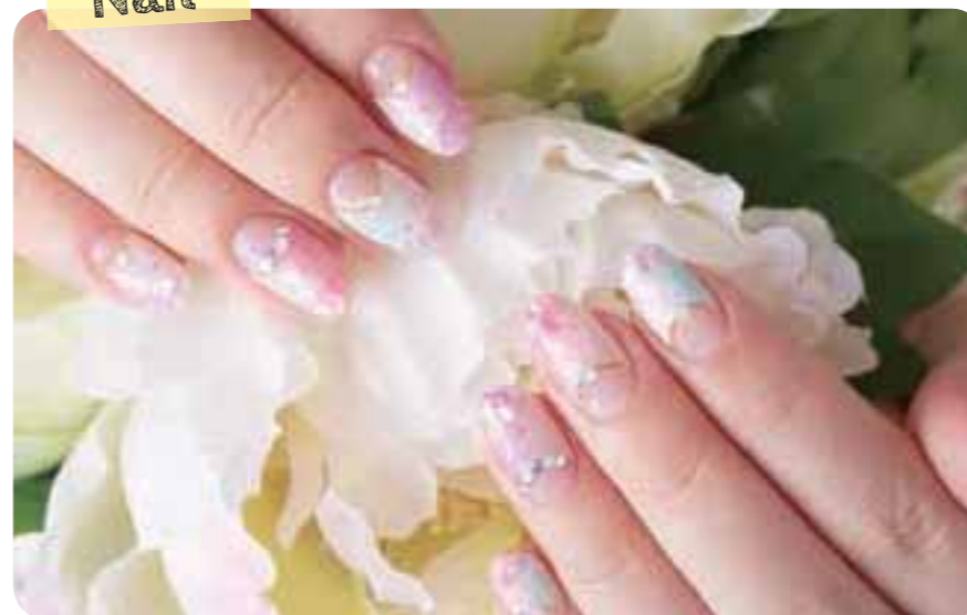
ハンド、フットともにセンスの良いデザインがそろう。再来店の方にも割引あり。