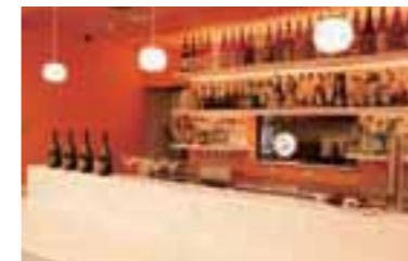
人気のカクテルをはじめ、ドリンクメニューも充実。

新百合ヶ丘駅北口ロータリーの目の前にあるカラオケ店が、営業時間を朝5時まで延長(9/15祝まで)! ママ友や家族連れに評判の本格的な料理、種類豊富なドリンクとともに、夜を満喫しよう。3日前までの予約で、室料2時間+料理+飲み放題がセットのコース(1人3,100円~)も利用可。少人数で楽しめる個室から最大35名収容可能な大部屋まで全19室。お得なフリータイムもぜひ。