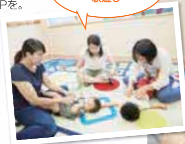
親子でふれあいながら歌遊び