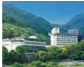
七五三のお祝いは忘れられない思い出に(右)。定評ある湯本富士屋ホテルの料理(左上)。箱根湯本駅徒歩3分の好立地に立つ(右下)。