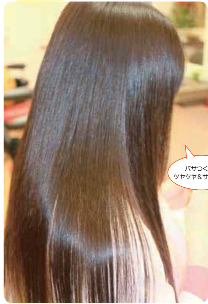
ハサミとクシだけで行うフレンチカットとクリニックカットで“塗らないトリートメント”が実現。