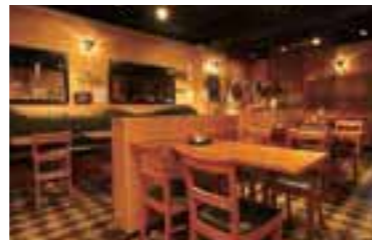
新百合ヶ丘駅北口から徒歩2分。異国情緒たっぷり!