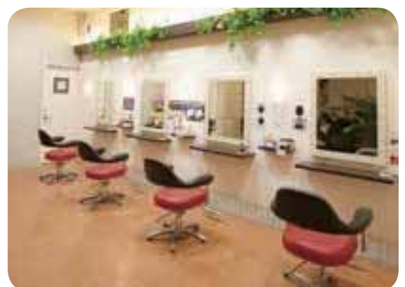
「電子トリートメントプロフェッショナル認定店」のルシル。柿生駅より徒歩1分！