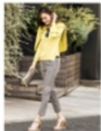
春夏の新作アイテムが並ぶファッションショップ