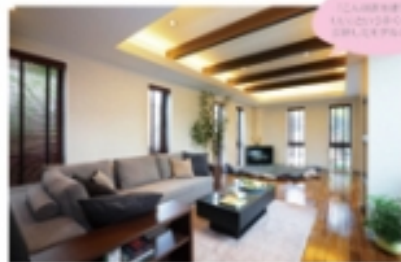
1.110坪の広さを誇る、1.5LDKのモデルハウス