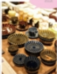
カラフルな色合いの陶器雑貨

3月に新店が相次ぎオープンし、さらに魅力が増したたまプラーザ。テラス1号でも話題は、メイドイン・ジャパンの食器の雑貨などを取り揃え、食器の専門店に初出店の「日本器楽器」です。ほかにも、心地良さど「ソラサカジュエル」を運営する「ソラサカストーン」が、子どもから大人まで楽しめる「たかし 夢」など、新しいタイプの店舗が相次ぎオープン。