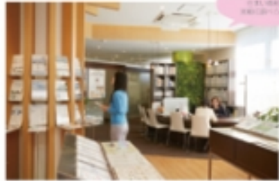
住まいの検討は、まずココへ

「家を買う・売る・建てる・リフォームしたいなど、住まいのことで何かしたい時、ネットや友人の口からだけで会社探しをしようとする人が多いですが、意外な落とし穴もあり、後悔できるお家探しを見極めるのは大変！ここでは、100社以上の優良会社の中から、お家探しに合った会社を紹介、相談無料で見積もり比較などお役立ちサービスを提供。