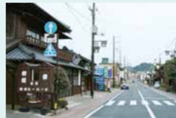
蔵造りの老舗など、城下町の面影が残る大多喜。