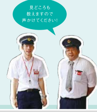
見どころも教えますので声かけてください!