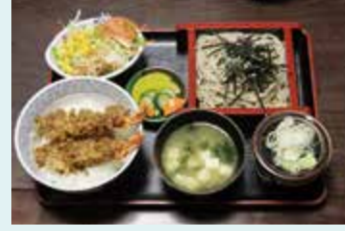
そば処くらや 〆0470-82-2757 千葉県夷隅郡大多喜町久保163 11時～17時 水曜定休 もとは農耕馬や牛の鞍を造る店で、屋号が「くらや」だった。コシのあるそばと、甘めのつゆが特徴。夏場は天丼・ざるセット(980円)がおすすめ。

千葉県立中央博物館 大多喜城分館 〆0470-82-3007 千葉県夷隅郡大多喜町大多喜481 9時～16時30分(入館は16時まで) 月曜休館(祝日の場合は翌日休)