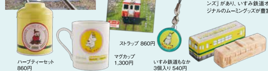
ハーブティセット 860円 ストラップ 860円 マグカップ 1,300円 いすみ鉄道もなか 3個入り 540円

国吉駅には、日本初の駅中ムーンショップ「ヴァレーウインズ」があり、いすみ鉄道オリジナルのムーングッズが豊富！