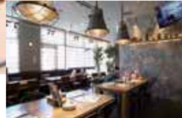
大きな窓が開放的な店内は、夜はぐっしょりと落ちついた雰囲気。お洒落なインテリアに話も弾みそう。

7月にオープンしたニューヨークスタイルのダイナー。話題の熟成肉を中心としたグリル料理やアラカルトメニューを、豊富なドリンクとともに楽しめる。旬熟成肉ステーキ(4,500円＋税)は、国産牛芯玉・内モモ・豚バラの3種。どれもかむほどに肉汁と旨みが広がり、笑みがこぼれる。セットメニューをリーズナブルにいただけるランチや、デザートがおいしいカフェタイムにもぜひ訪れたい。