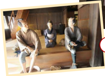
弥次さん喜多さんご到着!