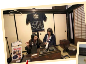
長火鉢の前で柏屋の 主人になった気分