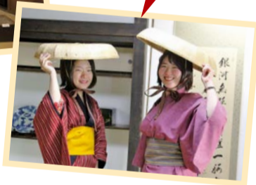
江戸時代の 旅人に早変わり!

二十一番目の宿場「岡部宿」。山あいの小さな宿場跡に、江戸の名残ある家並みが続く。