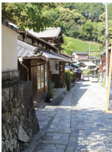
旧東海道 昔の街並みが残る旧東海道