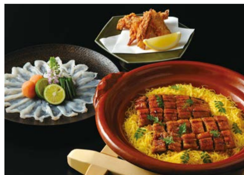
名物の鰻とふぐを味わえる特別会席「ふぐうな会席」