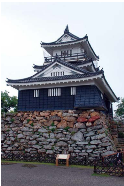
天守内部には、徳川家康をはじめとする武将ゆかりの品々が展示されている。

左手に三方ヶ原の古戦場跡。右手奥に浜松城。手前には「颯々の松（ざざんぎのまつ）」が描かれている。浮世絵の場所は、現在の子安町から馬込橋の間など諸説あるが、現在では、高い建物が並び立ち、浜松城を遠望できる場所は見当たらない。