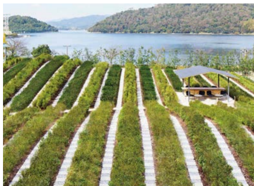
浜松の伝統工芸「遠州綿紬」の縞柄を彷彿とさせるツツジと茶の木を交互に配した茶畑。

静岡県浜松市西区館山寺町399-1 ☎0570-073-011(界 予約センター) JR浜松駅から無料送迎バス45分(要予約) https://kai-ryokan.jp/enshu/