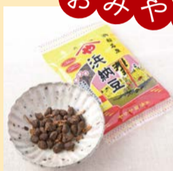
浜納豆 100g入 460円