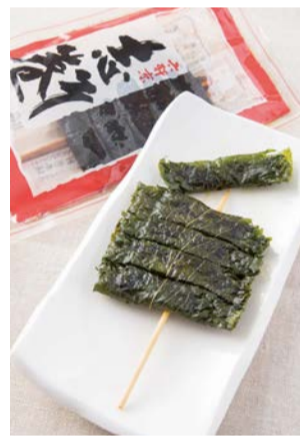
志そ巻(赤) 2串入 310円 志そ巻(青) 1串入 191円

店内には武者小路実篤が揮毫した店名の額装が。趣ある老舗を訪ね、求める素朴な味わいは、また格別だ。