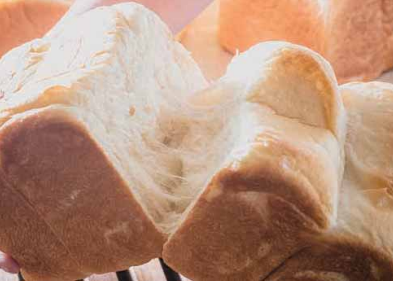
ゆめちから単一品種と天然酵母の「ゆめちからもちもち生食パン」。

マブレ2階に、町田でいつも行列している人気食パン専門店がオープン！原材料に使用しているのは、単一品種では商品化が難しいとされていた北海道十勝産の超強力小麦粉「ゆめちから」。もちもち感としっかりとした味わいのために、3年の歳月をかけてレシピを完成させた。コンセプトは「パン以上、ケーキ未満」。その言葉には「しあわせを感じる瞬間に笑顔になってほしい」という意味が込められている。「もともとは広告会社の社員食堂の限定メニューがおいしいと話題になったのがきっかけ。無添加の製法にこだわり、健全な美味しさを追求した特別なパンです」と同店スタッフ。