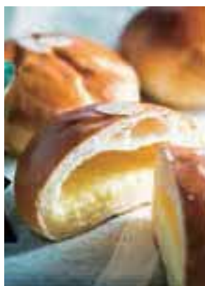
しんゆりパン祭りで好評だったクリームパン。