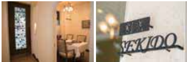
冬の釜炊きご飯にはズワイガニがたっぷり(写真は一例)。西洋の食材や器を取り入れた和と洋の美食が楽しめる(上)。アールヌーボー調のしつらえが美しい店内には個室も。記念日や少人数の集まりにぜひ(下左)。