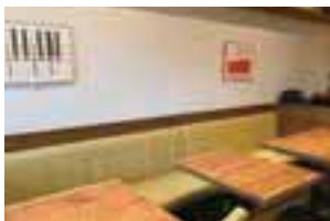
「本日の気まぐれコース」の一例。生春巻き、旨辛よだれ鶏など、どれもシェフ自慢の料理だ(上)。ランチはラーメンのみ提供(下左)。店内には広々としたテーブルのソファ席も(下右)。貸切プランは問い合わせを。