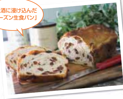
ラム酒に漬け込んだ「レーズン生食パン」

マブレ2階に、町田でいつも行列している人気食パン専門店がオープン！原材料に使用しているのは、単一品種では商品化が難しいとされていた北海道十勝産の超強力小麦粉「ゆめちから」。もちもち感としっかりとした味わいのために、3年の歳月をかけてレシピを完成させた。コンセプトは「パン以上、ケーキ未満」。その言葉には「しあわせを感じる瞬間に笑顔になってほしい」という意味が込められている。「もともとは広告会社の社員食堂の限定メニューがおいしいと話題になったのがきっかけ。無添加の製法にこだわり、健全な美味しさを追求した特別なパンです」と同店スタッフ。