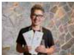
ホテルでフレンチシェフを務めた料理長が新たに就任。

10/24から新メニューに。さらにおいしく！コストのよさはそのままに、料理のクオリティを見直しカジュアルリッチに。おすすめはBONDISプラッター(前菜4種の盛り合わせ)、自家製ライ麦パン付き。人気の味が楽しめる。