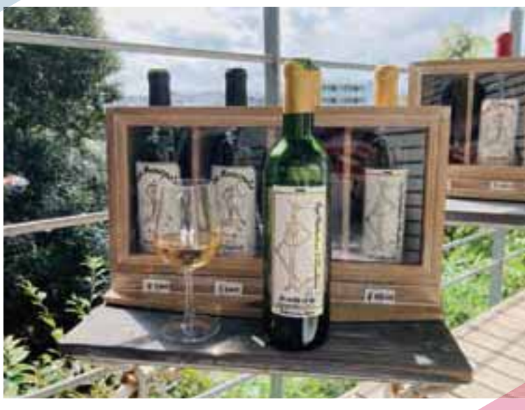
土作りや葡萄の選別などにこだわった単一自家農園のワイン。 自家栽培葡萄を100%使用。