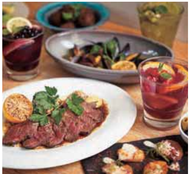
朝から夜まで開いているカフェ&レストラン。団体予約、テイクアウトも可。