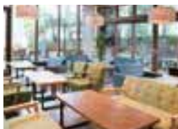
ソファ席もある広々とした店内。テラス席は感染予防+ベット可。