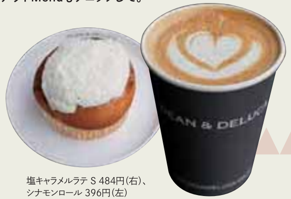
塩キャラメルラテ S 484円(右)、 シナモンロール 396円(左)