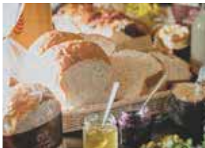
ミネラル豊富な「全粒粉生食パン」