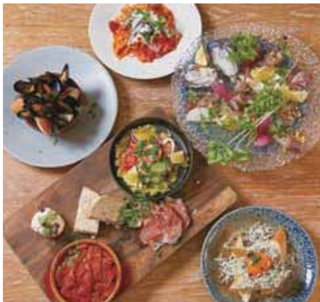
神奈川県産の釜揚げしらすを使った「アヒージョ」(写真右下)。卵と絡めると濃厚な味わいに。

入店時または予約時に「ミスモを見た」とお伝えください。店舗によっては「本誌を持参」していただく場合がありますので、ミスモ特典の但し書きをご確認ください。