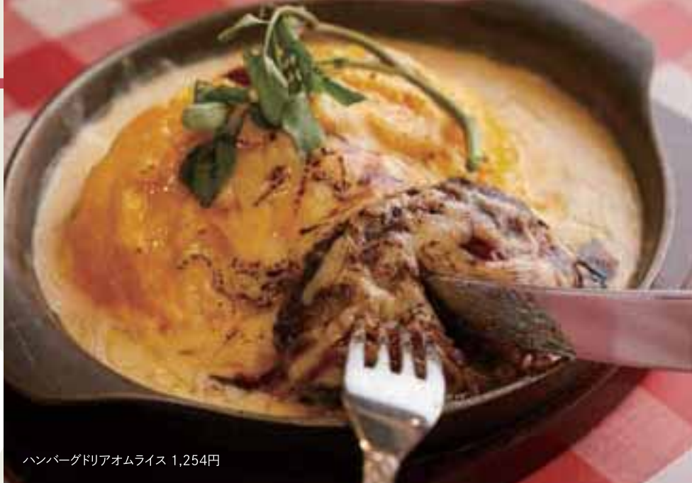
ハンバーグドリアオムライス 1,254円