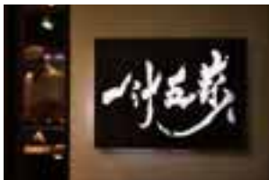
地元野菜を使った新鮮素材と奇をてらわないシンプルな調理方法がこだわり。店内でいただくコース料理は3,480円+税～。シェフはなだ万で修業した後に開店。おせちは素材本来の味や色が楽しめるように薄味で上品な味付け。