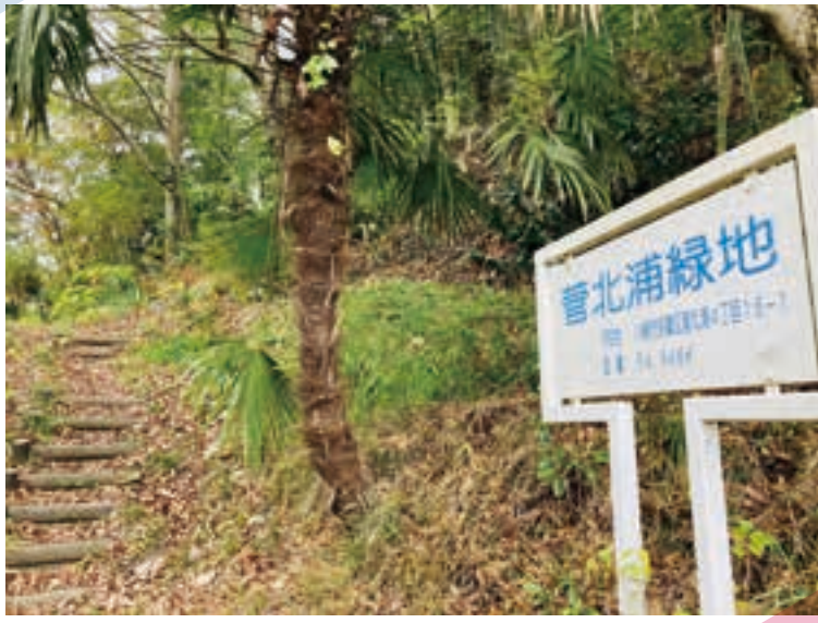
写真はJR南武線の稲堤駅から600mほど歩いた旧三沢川沿いにある菅北浦緑地。「多摩自然遊歩道」のコースにもなっています。

2021年最初の街角ワンショット！ 本年もよろしくお願ひいたします。 それにしても昨年はコロナ禍で大変な 1年でした。年が変わったからと言って、 その脅威が無くなるわけではありませ ンが、少しでもウイルスの脅威が減るこ とを、皆さんの生活が穏やかになること を願っています。引き続きマスクの着用 やしっかりと手洗い、室内の換気をこま めにして、外では密を避けて感染防止に努 めていきましょう！ さてこの街角ワンショット、今回原稿 を書く前にバックナンバーを振り返っ てみたんですが、ワタクシの連載って 2011年11月号から始まっていたんで すね！つまり今年の11月で10周年にな るんですよ。ビックリ！しかもスタート した当初は毎月発行だったんですよ。つ まりスタートしたときは毎月締め切りが きていたのか…。今は隔月でもヒーヒー なのに笑)。でも、長く連載できている のは素直にうれしいですね。改めて読ん でくださりありがとうございます！ そんな節目の年になる今年最初は、川 崎市多摩区エリアの「多摩自然遊歩道」の 話題をお届けします！ちなみに川崎市内 には8つのコースがあり、以前この連載 でも「柿生の里散歩道」は触れたことがあ りましたね。「多摩自然遊歩道」は区内