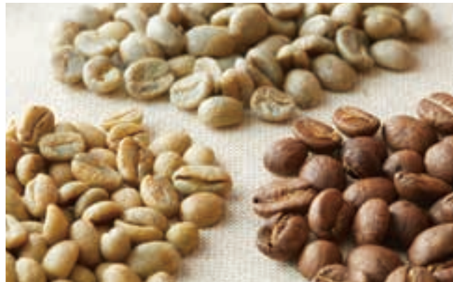
家で極上のカフェタイムを。マグカップやコーヒーメーカーなどグッズ販売も。