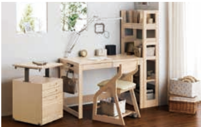
棚、チェストラック、袖引き出しなどを加えればオリジナルの学習空間に。