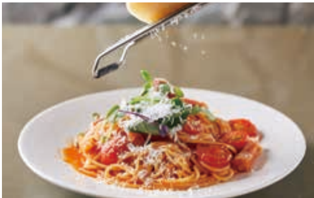
ベーコンと完熟トマトのアマトリチャーナ。