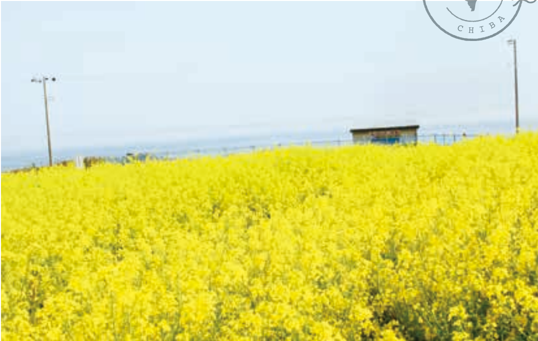
道沿いに広がる菜の花が黄色いじゅうたんのよう。