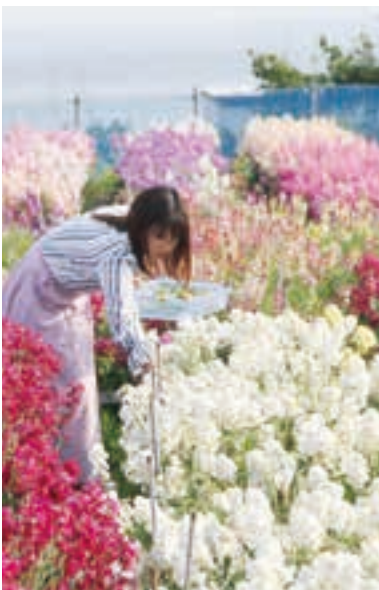
売店も並びフレッシュな切花を買うこともできる。

温暖な気候を利用して花き栽培が盛んな南房総。白間津（しらまず）には約20軒の花畑があり、太平洋を見渡せる花畑で菜の花、キンセンカ、ストック、ポピーなどの花摘み体験ができる。晴れた日には青い空と海、カラフルな花々のコントラストが鮮やか。インスタ映えする1枚を狙いたい。花畑を巡って散策しながら南房総の春の日差しを楽しむ、素敵な1日になりそう。入場は無料。