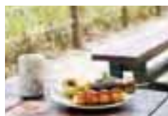
みたらしあんとの組み合わせが 絶妙(上)。景色を眺め一休み (右)。