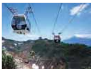
早雲山～大涌谷間を 行く箱根ロープウェーに乗れば、地上から見るのとはひと味違う大迫力のパノラマを楽しめる。

大涌谷を仰ぐと目に留まる、とんがり帽子のような山、冠ヶ岳。この山が誕生したのは今から約3000年前、カルデラと呼ばれるくぼ地の中にある神山が水蒸気爆発を起こし、山崩れが発生。このとき地下から上昇したマグマによってできたのが、冠ヶ岳だ。今も絶え間なく白煙湧き上がる大涌谷は、この噴火活動を今に伝える貴重な名残。崩れた土砂は早川をせき止め、芦ノ湖誕生につながった。 箱根の成り立ちと深い関わりがあり、地球と火山の息吹きをダイレクトに伝える大涌谷が、活発な火山活動により立ち入り禁止となったのは、2015年5月のこと。火山活動の鎮静化に伴い、2019年秋には、大涌谷エリアを運行する箱根ロープウェイが全線で運転再開、駅周辺の土産物店なども営業を再開したが、安全確保のために、最後の最後まで規制がかけていたのが、火山活動エリアに敷かれた遊歩道、大涌谷自然研究路だ。 その研究路がこの春より、監視員が誘導する引率入場方式により、待望の再始動を果たした。7年間閉ざされていた研究路は、噴気地帯は、どのようになっているのだろう。大涌谷の今を体感するために、再整備された一周約700mの研究路を歩くことにした。