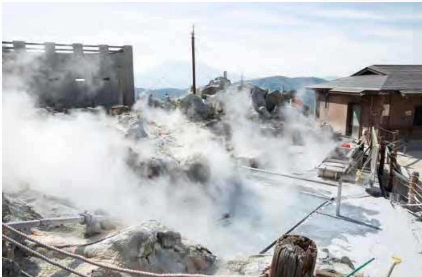
研究路最奥の温泉池。雲がなければ富士山も(上)。展望台から望む噴煙地。手前に見える段状のものは地滑り対策(下)。