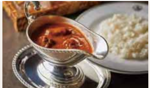
カレーのルーに加えたコンソメが芳醇な味わいをつくる(上)。スタンドグラスが華やか(下)。