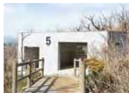
直径30cmの噴石に耐えられるシェルター。奇数番号のシェルターは30人ほどが入れる広さ。

引率入場の受付で訪れる大涌谷インフォメーションセンター奥には、火山や箱根の歴史をわかりやすく紹介する「箱根