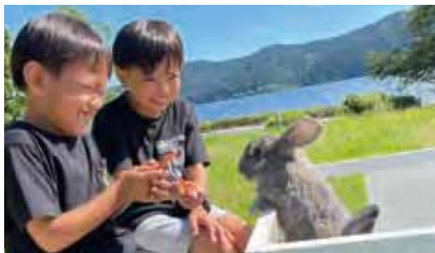
夏休みの思い出に、可愛い写真をたくさん撮ろう。