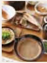
麦飯に粘りと風味 抜群のとろろをか けて(左)。「至高の 昼ご飯」3,380円 (右)。