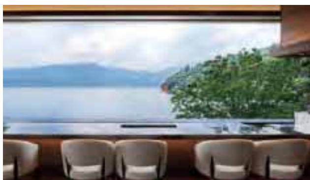
眼下の芦ノ湖が非日常を演出(上)。 ホットサンド2種盛りが人気(下)。