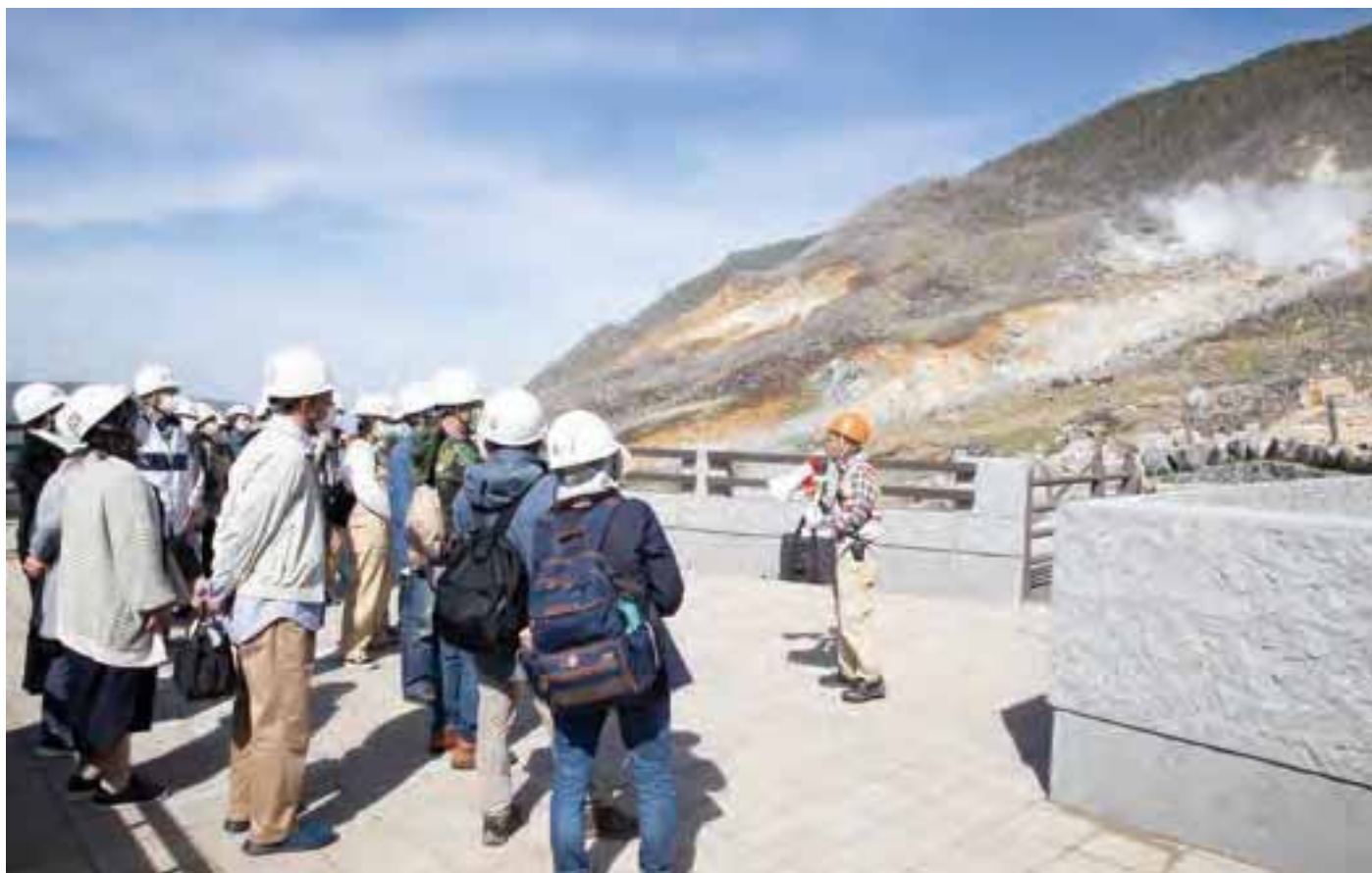
4号シェルターの屋上展望台で監視員の話に聞き入る。参加者は入場時に配布されるヘルメットを装着する。