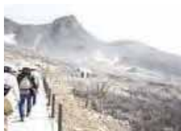
2019年、観測史上最多の雨を記録した台風19号の爪痕がそのまま残されている(左)。最も大きな4号シェルター屋上からの眺め。富士山も見える(中)。研究路の通路は緊急時に走って逃げられるよう舗装された。奥にそびえるのは標高1409mの冠ヶ岳(右)。