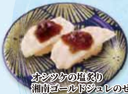
オシツケの塩炙り 湘南ゴールドジュレのせ

小田原のソウルフード全身トロと言われる 脂ののったオシツケ 別名：アブラボウズ。 他にも骨切りをして食べるスマヤキなど 小田原ならではの寿司メニューが揃う。