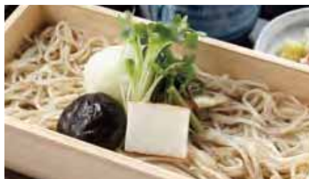
絹引雪割(上)は見た目も美しく人気の品。ミ スモ特典の味噌こんにやく(下)。