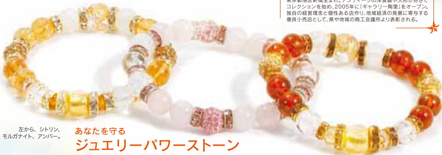
左から、シトリン、モルガナイト、アンバー。

うなきらめき。キラキラ輝く龍神様も大人気。さらに店内には、ヨーロッパのアンティークや一点物など、ほかにはない希少なアイテムも並ぶ。全国に約5600人にも上る、同店のリピーターからは結婚や出産、受験や仕事の成功など感謝の手紙が絶えず、「人生を後押ししてくれた」との声が続々。商品購入後のメンテナンスも万全で、郵送でも応じてくれる。他店で購入したものもご相談を（有料）。