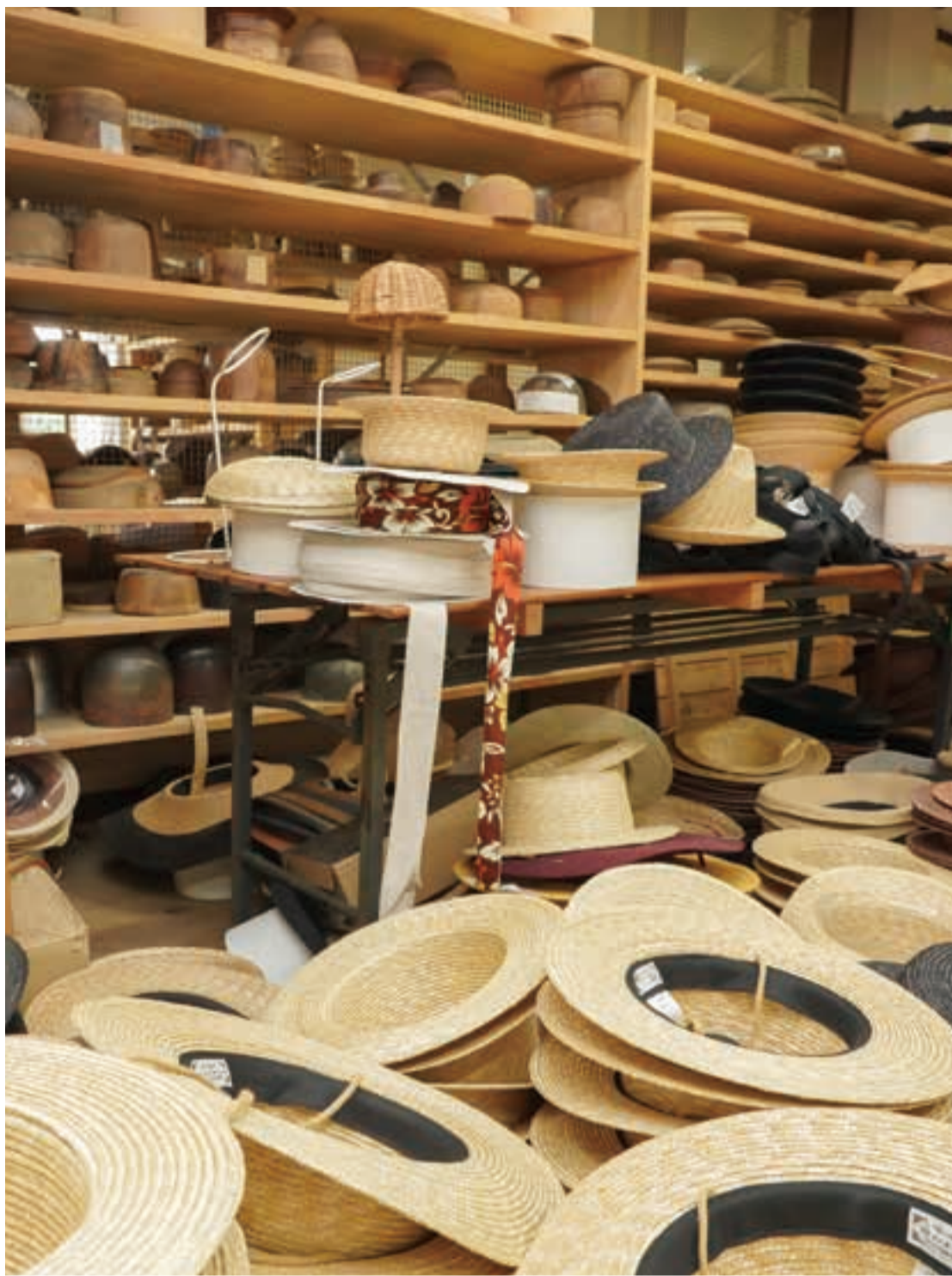
工場の棚にはさまざまな形の木型が並ぶ。頭部とつばの型の組み合わせにより、無数のデザインが生まれる。