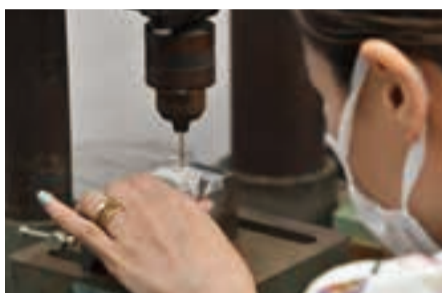
装身具や金工品を作る「ジュエリー&メタルデザイン」

玉川大学継続学習センターでは、未知なる知識との出会いや、技術を習得する面白さを体験できる講座を開講している。伝統文化を学ぶ講座や、本格的な作品づくりに取り組む講座のほか、日本文化に触れたり体を動かしたりと、玉川大学ならではの多彩な講座を用意。公的な資格取得を目指す講座や語学講座も。心の豊かさや生涯の生きがいのために、幅広いニーズに対応している。9/4(月)からは、秋から開講する講座の申込受付がスタートする。初心者対象のクラスも豊富なので、楽しみながら新たな学びにチャレンジできる。また、「体験講座はじめての盛物」や「煎茶道体験講座」などは1回完結のため、日本の伝統的な文化にも気軽に触れることができる。月ごとのテーマに沿った運動を体験できる「TAMAGAWAカラダ改革クリニック」も人気だ。