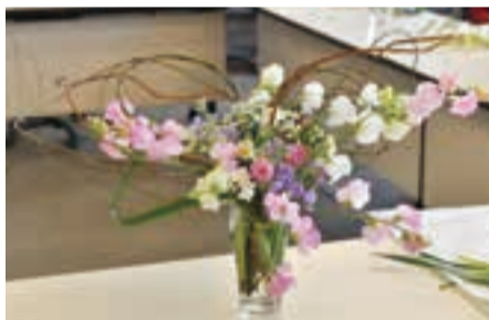
四季折々の植物との出会いを楽しむ「フラワーデザイン」