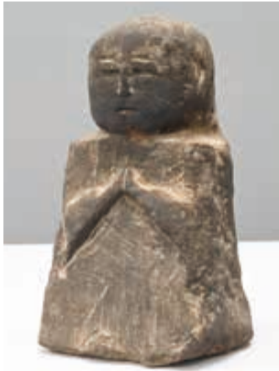
地藏菩薩像 江戸時代 河津町田中・小峰堂

伊豆・下田の上原美術館では、企画展「きれいな仏像 愉快的江戸仏」を9/24(日)まで開催中。収蔵品のほか、伊豆に伝わる素朴で愛らしい江戸時代の仏像を展示する。日本画家の錦木清方らを紹介する収蔵品展「雨をたのしむ」を同時開催。