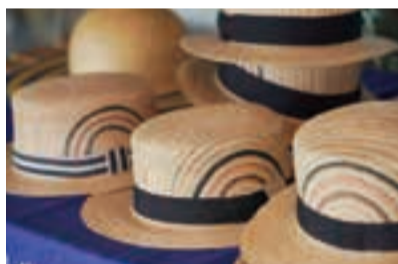
日本人の頭の形にぴったり合う帽子を作れるのが、田中帽子店の強みだ。上から見ると欧米人は楕円型、日本人は真ん丸の頭を持つという。