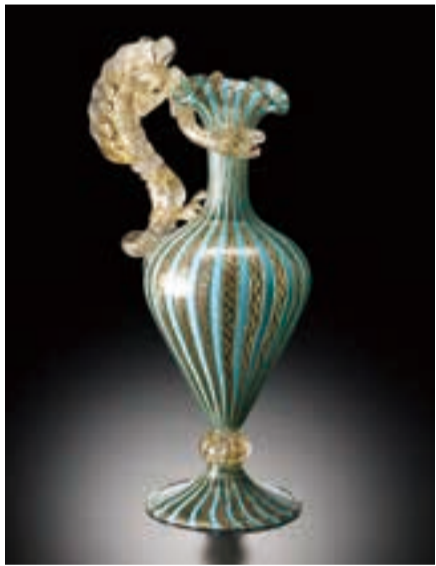
龍装飾水差 19世紀 ヴェネチア 箱根ガラスの森美術館所蔵

海上交易で栄えたヴェネチアにとつて、莫大な富をもたらした、様々な文物が行き交う海に住む龍は忌避(きひ)の対象ではなかったのだから。衰退の危機を乗り越えて再び脚光を浴びた龍からは、ヴェネチアン・グラス復活を高らかに告げる咆哮(ほうごう)が聞こえてくるようだ。