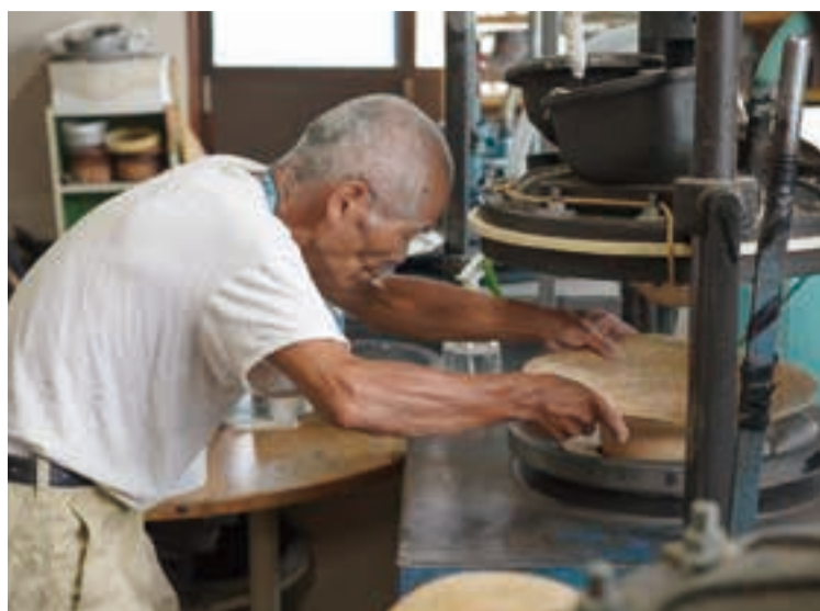
型入れを黙々とする職人さん。空気圧が主流の今、水圧でのプレスは希少となった。金型をガスの火で熱しながらの作業になるため「やけどはしょっちゅうです」。