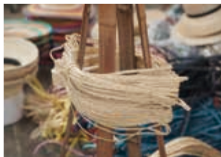
帽子の材料となる麦わら真田。かつては春日部の麦で生産していたが、今はモンゴルなどアジアから輸入する。