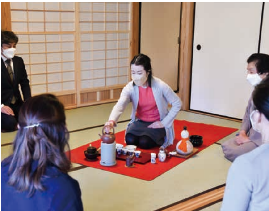
美しい所作とおいしい煎茶の入れ方が身につく「煎茶道入門講座」