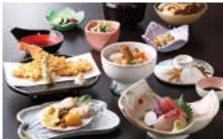
身が厚い「あじずし」と、特製ゴマ油が香る天重(右)。地元の味が満載の「桐定食」(左・写真はイメージ)。

入店時または予約時に箱根・小田原ごちそうMAPを見たお伝えください。店舗によっては「本誌を持参」していただく場合がありますので、ミスモ特典の但し書きをご確認ください。