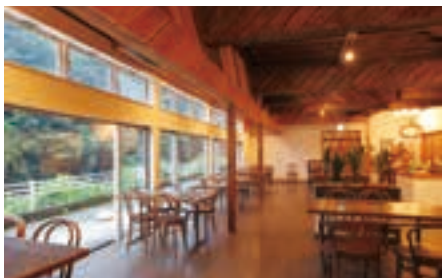
看板メニューの湯葉丼(右)。豆腐ぜんざい(中)。以前は旅館だった趣きある店内。カフェ利用も可(左)。