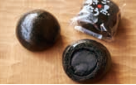
「箱根のお月さま。」(右)と「ご黒うさん。」(左上)。せいろで蒸した出来たても(左下)。