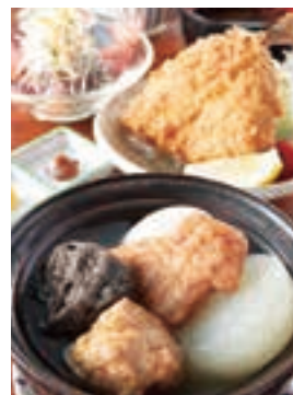
季節の鮮魚を存分に味わえる刺身の盛合せ(左)。小田原ならではの名物の小田原おでん定食(右下)。