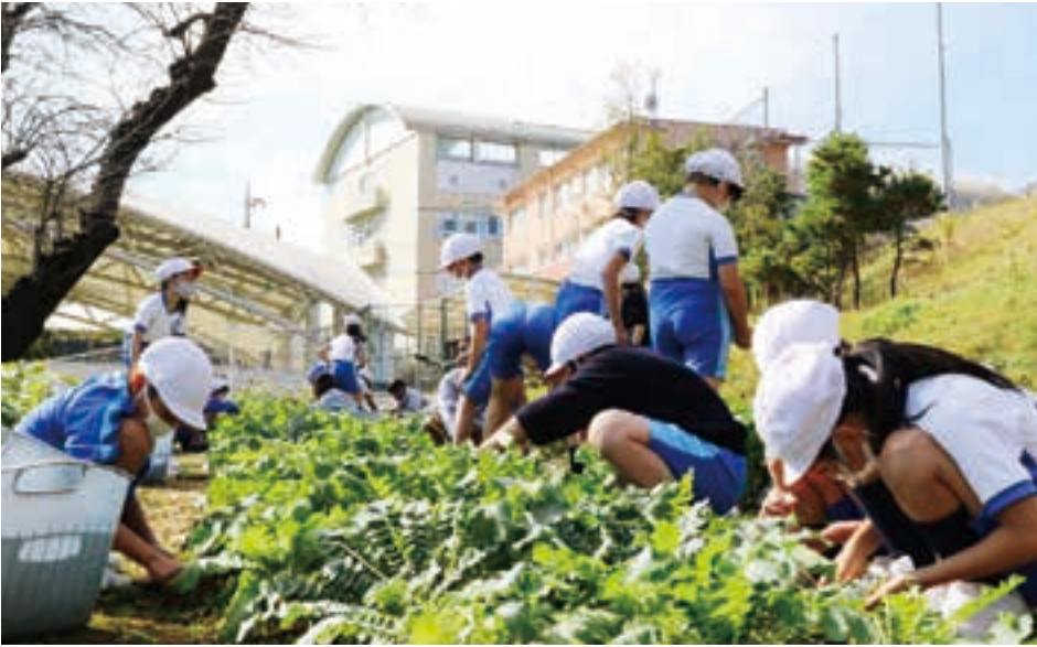
農園活動など特色ある授業が多い。