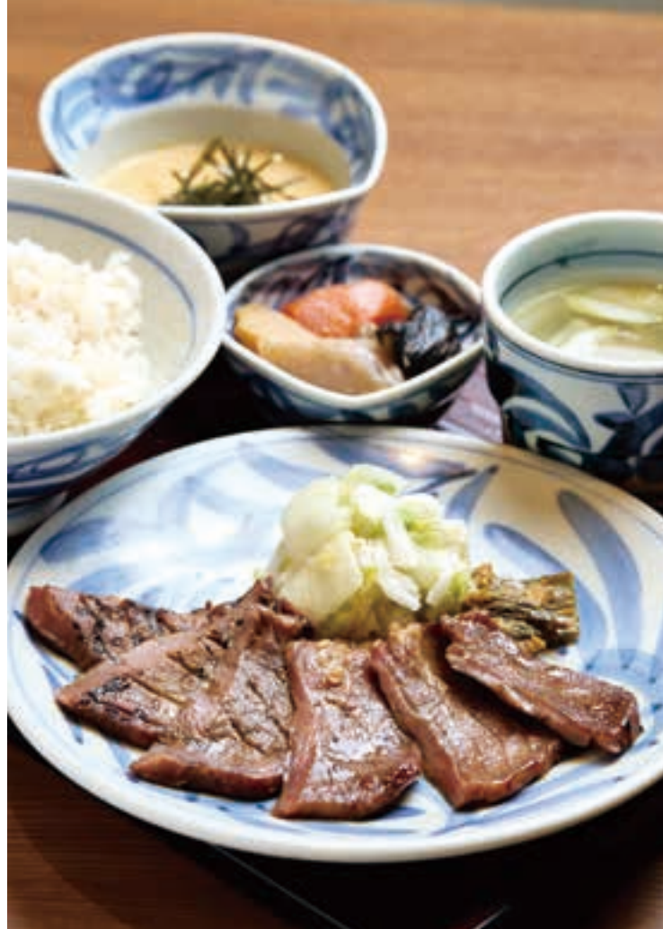
塩と味噌、2種類の味付けで牛たんを楽しむ「牛たん味比べ御膳」2,288円。