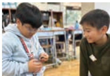
異文化交流の中で生きた英語を学ぶ。

雑木林のある自然豊かな小学校。仕切りのない開放的な教室とオープンスペースも特徴。学ぶ子どもたちが主人公であり、子ども自身が「勉強は楽しい」と感じる授業づくりを大切にしている。多様な本物との出会いを体験し、確かな学力と挑戦する力を育む。異文化国際理解教育として、人との交流を軸に、言葉やグローバルな文化を学ぶ。常設学童クラブあり。併設の中学、高校、大学へは優先的に進学可能。