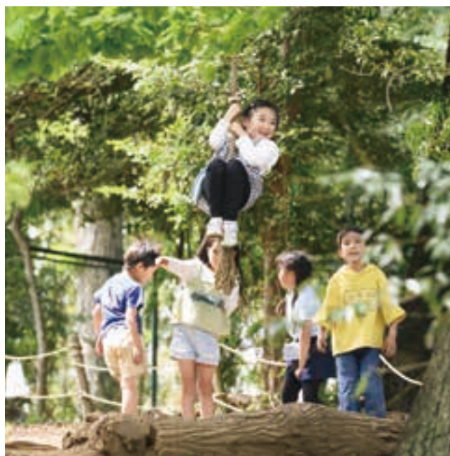
自然豊かな雑木林で生き生きと。