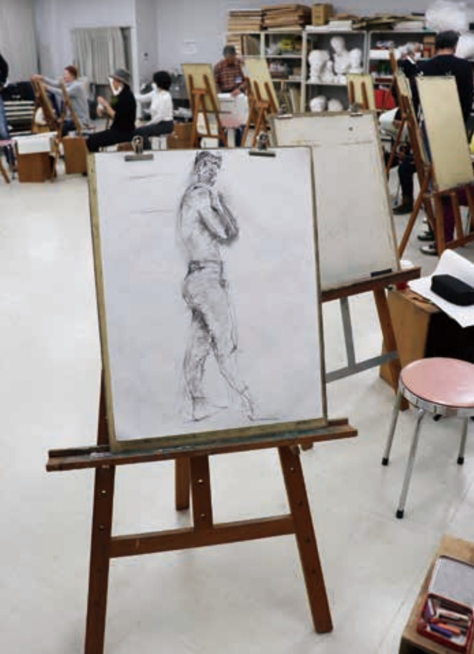
デッサン講座では多彩なデッサンの表現方法に取り組める。