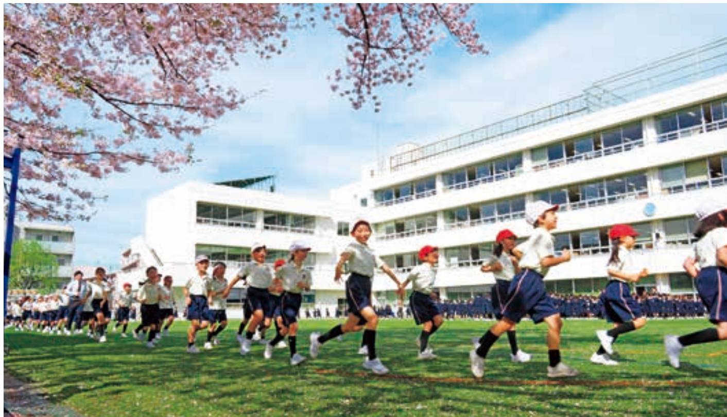
毎日朝礼前に校庭を走る「富士登山マラソン」。