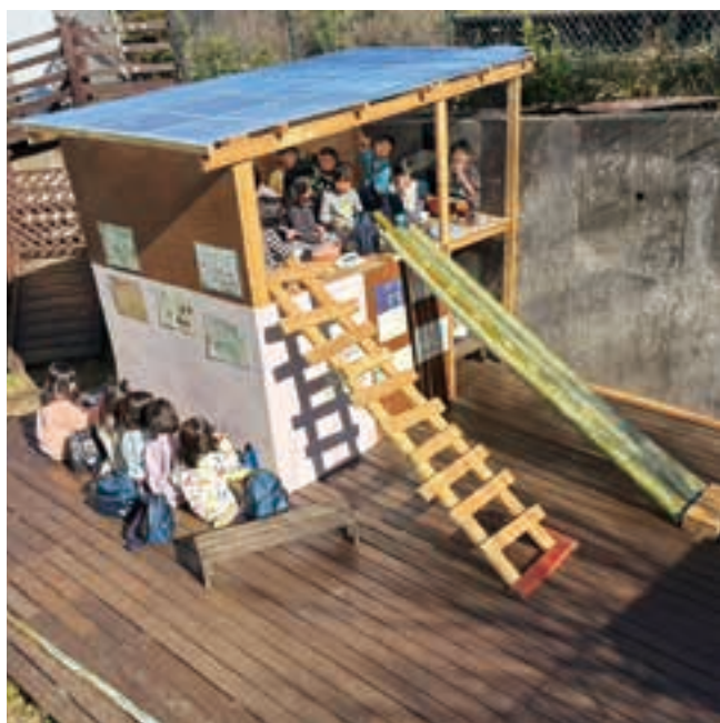
5歳児が作った「おうち」。「お弁当を食べよう！」