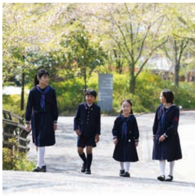
自然あふれる学園内。