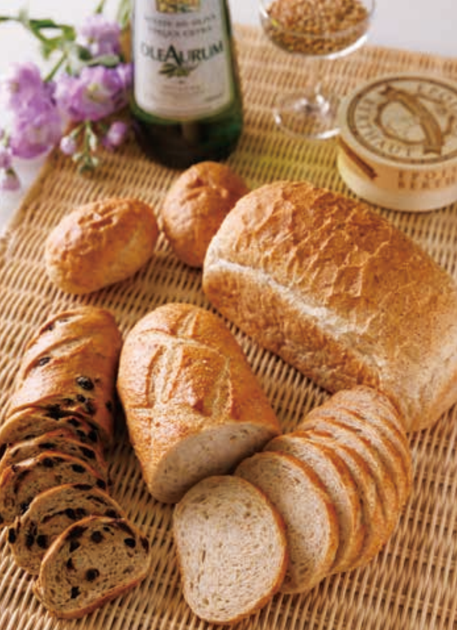
よくかむほどに小麦のおいしさを感じられる全粒パン。