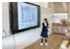
どの教科でも電子黒板・iPadを使用。

教育理念の「自分流」を根幹に据え、2040年代に世界を舞台に活躍するために必要な英語力や問題解決能力を育成しています。「自分の頭で考える」「ゴールイメージから」「多数決に頼らず納得解を作り上げる」「WIN-WINの重視」など、新たな教育活動に挑戦中です。