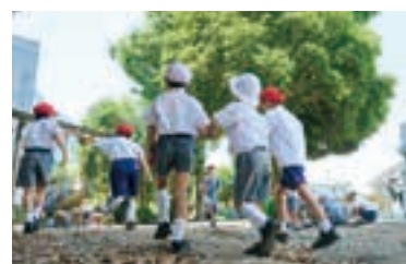
豊かな緑の中で育まれる個性。

世田谷の豊かな自然の中、カトリックの精神に基づき「よく生き、たくましく生き、愛し愛される人」を育てる。1学年2クラスの少人数制により、児童一人ひとりの成長を細やかに見守り、個性を尊重。英語やフランス語教育を通じて、異文化と出会い、多角的な視点と豊かな感性を養っていく。落ち着いた環境での学びと祈りの日々が、一生を支える「心の根っこ」を育成する。