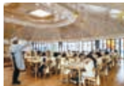
ランチルーム(新棟)での給食。

カリタス小学校は友だちと「ともに」たくさんの「だいすき」を発見、創造する学校です。動物飼育や多摩川探検で発見した「だいすき」は、話したい！書きたい！もっとやりたい！…と目を輝かせる学びにつながります。仲間と「ともに」たくさんの「だいすき」を見つけましょう。