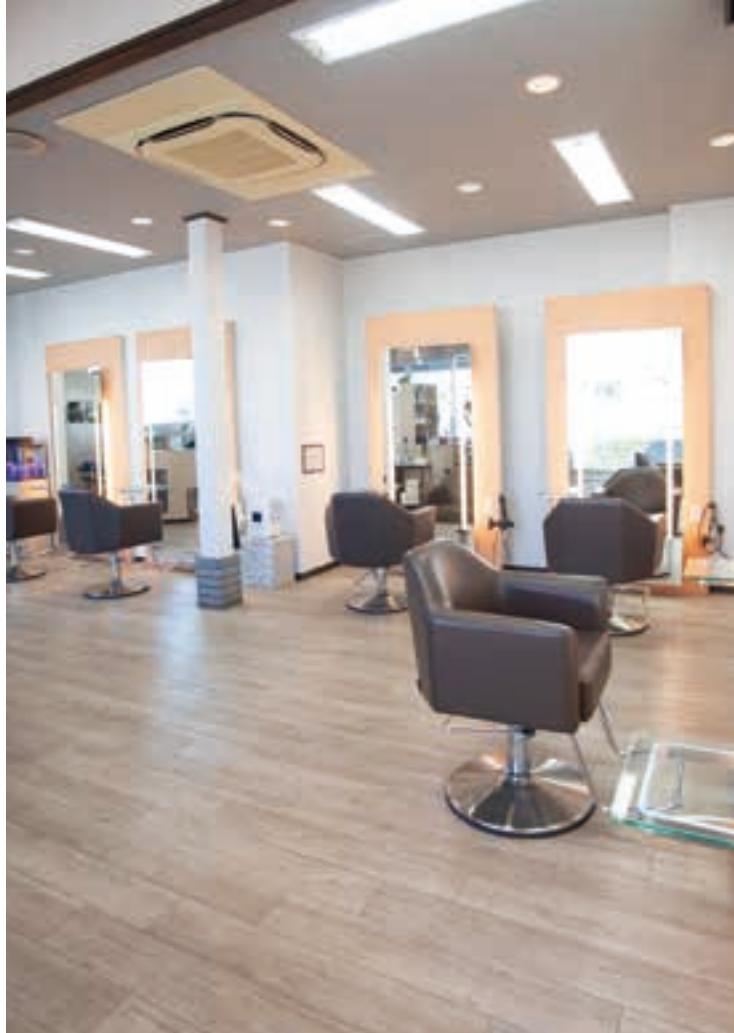
広々として開放感あふれる店内。リラックスして施術が受けられる。