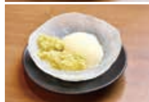
お子様用の「焼肉プレート」1,078円(上)。仙台直送のずんだを使用(下)。