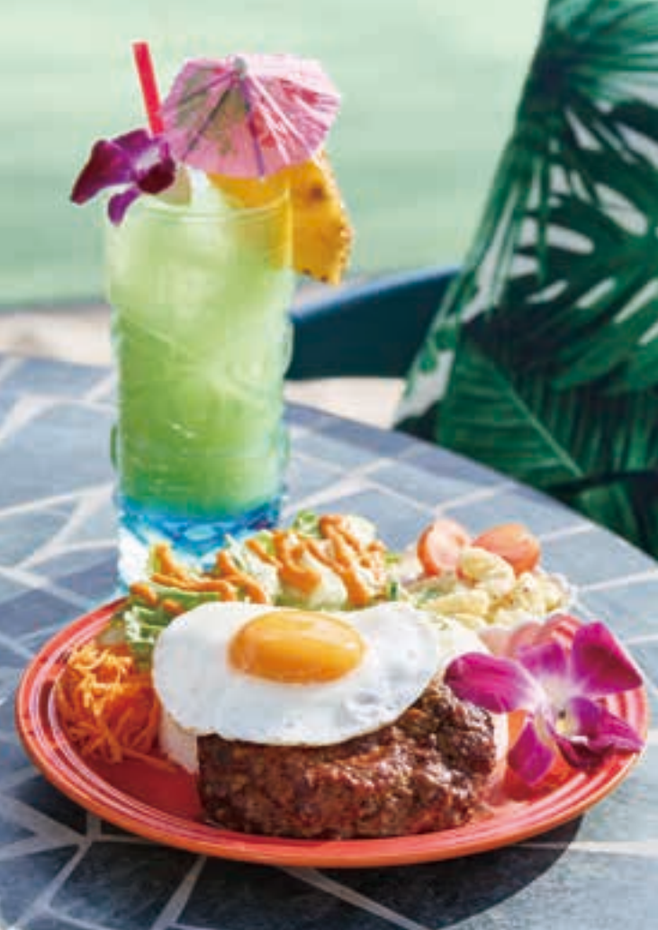
自家製デミグラスソースが味わい深い、ロコモコプレート1,419円。