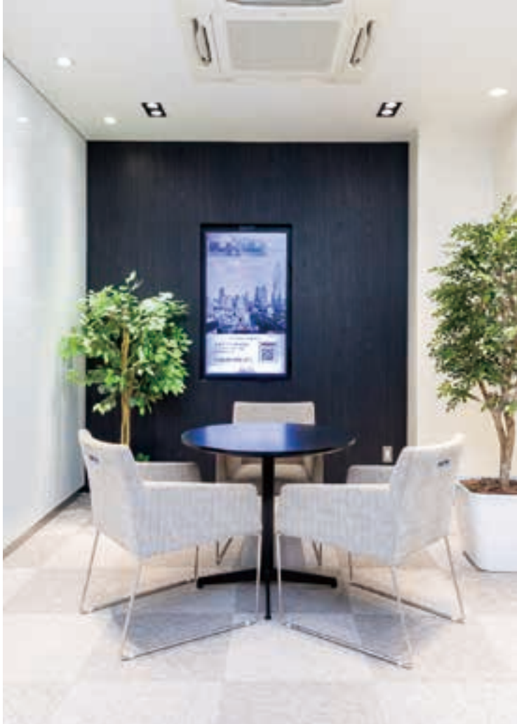
清潔感のある商談ルームは落ち着いて相談ができる。