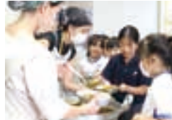
農園でできた野菜をみんなで。

教室では友だちと一緒に考え、話し合いながら学びます。休み時間には校庭やさまざまな場所で、好きな遊びや活動に取り組めます。一人ひとりが自分の好きなことや、挑戦してみたいと思うことを大切にできるように、私たちは子どもたちに寄り添います。