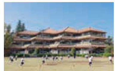
小1生～5生が学ぶK-12経路校舎。

創立者が残した一画多い「夢」という文字には、子どもたちに多くの夢を描いてほしいという願いが込められている。広大なキャンパスに幼稚部から大学院までが揃う総合学園として、「全人教育」という教育理念のもと、夢の実現に向けて歩む子どもたちを育てる「ゆめの学校」であり続けている。小学部では「ホンモノ」に触れ、自ら主体的に学び、自学自律の精神を身につけることを目指す。