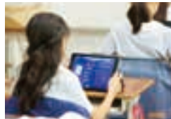
シンキングツールで思考力を育成。

子どもを中心とした学びで6つの力を育成。育成すべきコンピテンシー（資質・能力）を、「思考力」「創造力」「チャレンジ力」「メタ認知力」「思いやり」「エージェンシー」の6つに設定し、「子どもを中心とした学び」を推し進め、子ども自身が深く考え、発信することを教育の基盤に据えていきます。