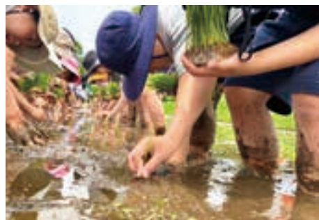
宿泊行事中には田植えも経験。

都心にありながら緑豊かで閑静な敷地にこども園から大学院までそろそろほか、米国州立テンプル大学ジャパンキャンパスも立つ。幅広い年齢層が学ぶ環境下、建学の精神「世の光となろう」のもと、3つの目標「目あてをさして進む人・まごころを尽くす人・からだを丈夫にする人」を掲げ、子どもの豊かな成長をサポート。加えて、グローバルに活躍する人材を育成するため「Lead Yourself ～自分リーダーシップの発揮～」を柱に、主体性を培う教育に力を入れる。2024年度から多くの時間を英語で学ぶ「国際コース」を開設し、「探究コース」との選択で子どもの学びを広げる。