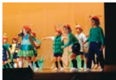
学芸会(見学可能)で表現する喜びを。

115年の教育実践から磨いてきたカリキュラムを基に、変化の時代にも揺るがない人としての土台を育むことを大切にしている。豊かな自然に恵まれた環境で、子どもたちは五感を働かせながら学びを深め、問いを育てていく。基礎学力と応用力に加え、社会の変化に応じた力を伸ばす教育を展開。「ランゲージ・アーツ」「ICT教育」「英語教育」を三本柱とし、探究的な学びを通して自立した学習者を育てていく。