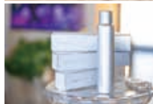
一軒家風のサロン(上)。自宅ケア用に、全身を潤す炭酸ミストも販売(下)。