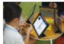
授業でiPadを使用。ICTの授業も。