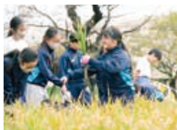
5年生は自分たちで育てた米を収穫する。