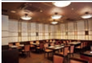
豪華な出前メニューの「わらび」(上)。落ち着いた店内でゆったりできる(下)。