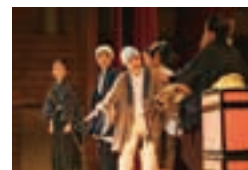
2月の「劇の会」は見学可能。