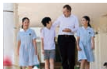
日々の生活で身につく英語表現力。

これからの時代に必要な表現力を各教科やオリジナル授業を通して培っていく。専任イギリス人教師による英語授業や英語演劇でも、自己表現力を育成。また、本物に触れる体験型授業や行事でのプログラムなど、五感を通じた学びも大切にしている。少人数・専科制のきめ細やかな授業や、興味関心に合わせて受講できる多彩な放課後講座(セシリアジュニアアカデミー全21講座)も同校の特長。