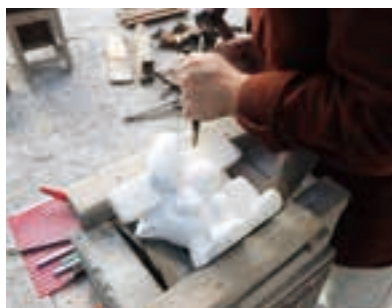
絵画から立体までさまざまな講座がそろう。