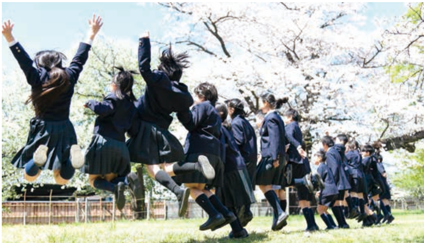
男女共学。友だちや先生とのつながりを大切にしている。