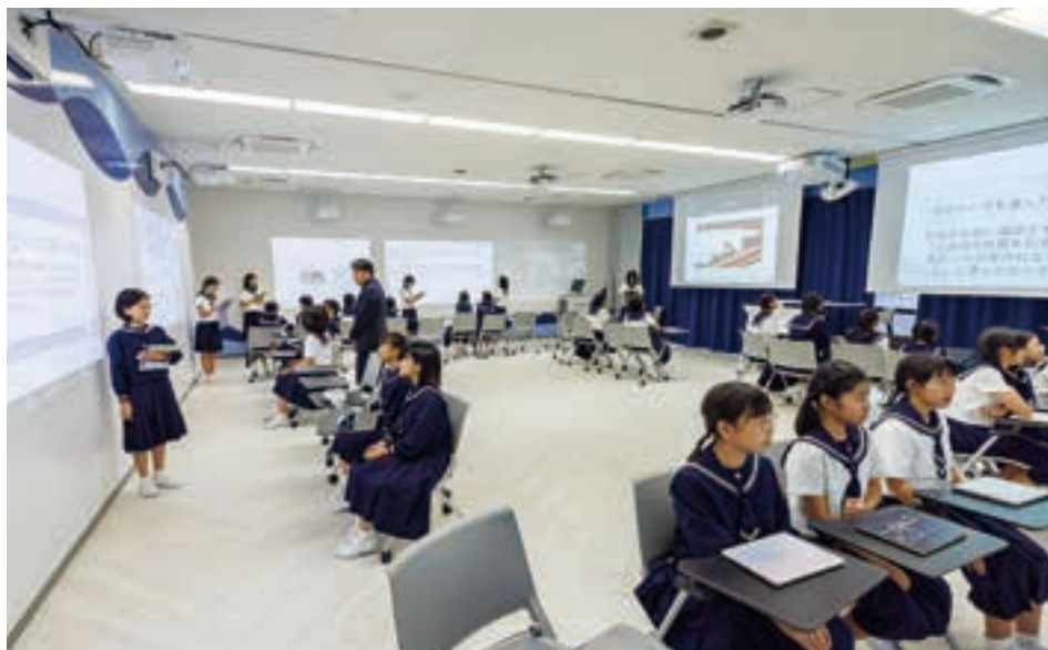
子どもたちの活発なやり取りが期待できる「ヴェリタス」。