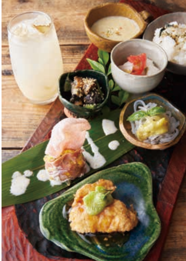
「日替わり生姜三昧ぜいたく盆」は総菜5、6品が付いてボリューム満点。