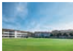
人工芝の広い校庭。

神の愛に生かされていることに感謝し、学んだこと、身につけたことを使って、人のために何ができるかを考え、変化が激しく明確な一つの解を導き出すことが困難な時代においても、主体的に行動しつつ、お互いを尊重し合い協働できる児童を育ててまいります。