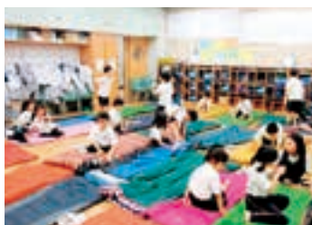
災害対策にも重きを置き、備蓄と訓練を行う。