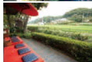
自然に包まれた店の前にはうららかな里山風景が広がる。