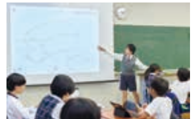
全教科でアクティブラーニングを実施。

桐蔭学園は横浜市北部、丹沢山塊や富士山を遠望する多摩丘陵南端に位置する緑豊かな自然環境の中にある総合学園。学園理念を踏まえ、大学進学後もしっかり学び、力強く仕事・社会で活躍する子どもを育てる「新しい進学校」を目指している。小学校では基礎的な学力と体力を身につけることを中心に、学校行事を通じて感性の涵養（かんよう）を図り、思考力・判断力・表現力などを育て中等教育につなげる。