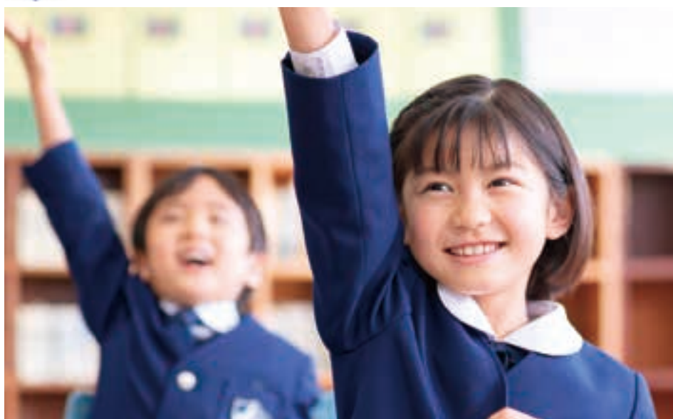
カトリックの精神を通して思いやりの心を育てる。