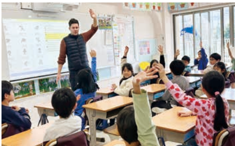
外国人担任から自然に学ぶ、異文化と多様性。