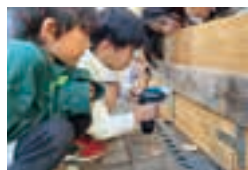
「おふろをつくりたい！」のひと声で。