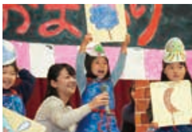
ストーリーから子どもとつくる創作劇。

自然教育・言語教育・非認知能力の育成が教育の三本柱である。学園敷地内の広大な森での遊びや観察活動を通じて、数量や形、距離などの感覚を体験的に学習する。発表や話し合い、絵本の読み聞かせを重ね「聞く・考える・伝える」力を身につける「ランゲージ・アーツ」の独自カリキュラムがある。また、子どもたちの発想から活動を広げることで、主体性や協働する力、粘り強さなどの非認知能力を丁寧に育てている。