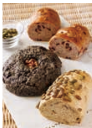
カボチャやゴマをふんだんに使ったアインコーン30%のパン。