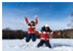
多様な体験で育む好奇心や探求心。

本校は、英語や体験学習、放課後講座の充実など、ここ数年でよりよい方向に大きく変わりました。しかし、創立から全く変わっていないこともあります。それは「あなたは大切な人である」ということを伝えるカトリック校としての「愛の教育」です。これは変わることのない本校の大切な使命です。