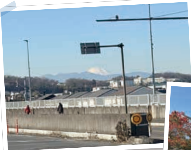
雪化粧が美しい！富士山をパチリ（左）。公園にたたずむ旧多摩水道橋の親柱（右）。