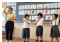
ネイティブ教員による英語学習。

本校の教育理念は「自主性と創造性」です。子どもたちがお互いに意見を言い合い、お互いに協力して創り上げる取り組みや、机上だけでは学ぶことができない体験を通して、好奇心旺盛で豊かな感性を持った児童、主体的に学ぶ力と新しいことに挑戦していくエネルギーを持った児童を育てていきます。