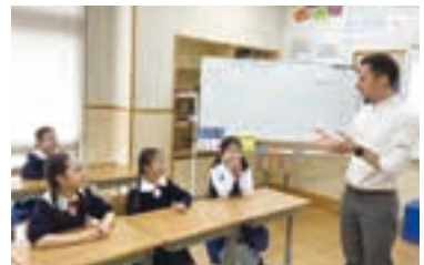
少人数での外国語指導。

多摩川で遊び、ヤギや羊たちと過ごす学校生活は、子どもも教師も夢中になって楽しめる時間と空間があり、ともに成長できる環境。保護者も学校行事に積極的に参加し、子どもを温かく見守っている。1年生から英語・フランス語の複言語教育を少人数で実施。ICT機器も活用。2024年9月には新棟が完成し、専科教室をリニューアル。自校調理方式の給食も始まり、好評である。