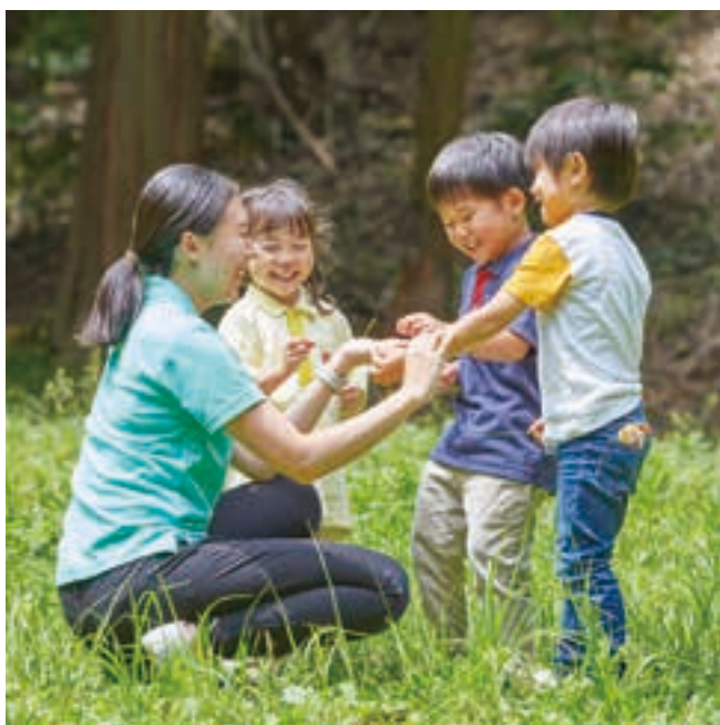
豊かな自然環境を生かした活動が豊富。