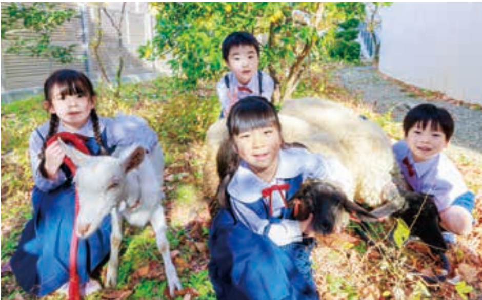
動物たちの小屋の掃除や散歩も、子どもたちが行う。