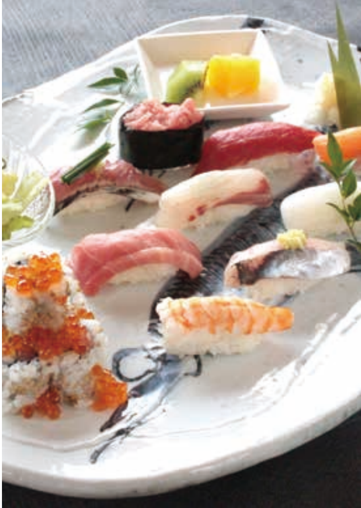
ランチ限定メニューの「しんゆりプレート」2,200円。