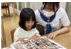
高校生との交流会。