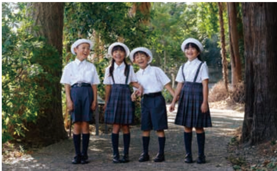
「ゆたかに、のびやかに」。新しいことにチャレンジする姿勢を育む。