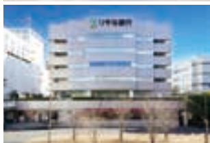
小田急線新百合ヶ丘駅南口から徒歩2分の好立地。店内にキッズコーナーも完備。