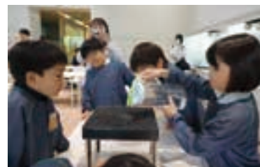
キャリア教育イベントの様子。

子どもたちが「なりたい自分」を目指して学んでいけるよう、キャリア教育に力を入れている。取り組みとして、2025年も「キャリア教育イベント」を実施。10社以上の企業や団体の協力のもと、仕事の魅力や大変さ、働くことの意味などを学んだ。また、里山を「知る」、「守る」、「親しむ」、「利用する」ことをテーマに構内にある「ぼんぼこ山・畑・竹林」を使った里山教育も行っている。