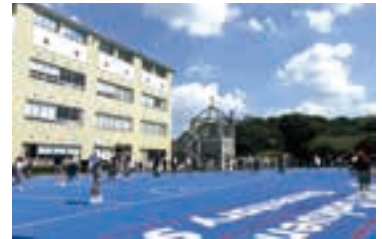
2つのグラウンドは休み時間でも使用可。

自然に囲まれた環境にある小学校。意志・表現・感謝の3つの校訓を通して豊かな心を育む。日々の授業では学び合う楽しさを、学校行事では男女が力を合わせて成しとげる喜びを感じられるよう、独自のカリキュラムで充実した教育を展開する。また、家庭学習と連動させながら学習の基礎を定着させることを大切にしている。複数担任制によるきめ細やかな指導も、桐光学園小学校の特色である。