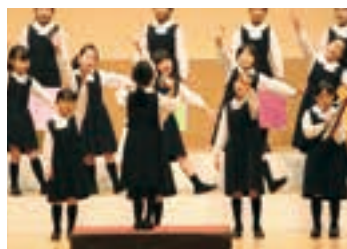
毎年12月に、人見記念講堂で開催される音楽会。