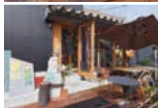
看板メニューの「とんきこフリッター」(上)。テラス席はペット連れも可(下)。