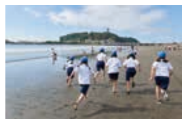
徒歩10分の江ノ島海岸で行う「海の活動」。

9台のプロジェクターが設置され、iPadで画面を共有しながら、プレゼンテーションやディスカッションを行うことができる。没入型プロジェクションマッピングの投影も可能で、子どもたちの探究心をくすぐる空間に。ラテン語で「真理」を意味する「ヴェリタス」。多様な考えの中に生きる子どもたちが、小学校での学びを通して、自分の考えや道標を見出してほしいという願いが込められている。