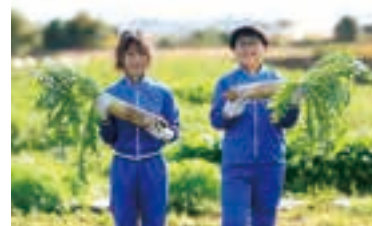
大学の農場で自分が育てた野菜を収穫。

日本大学生物資源科学部のキャンパスに抱かれたゆとりある豊かな環境の中で、子どもたちの個性を大切にしながら、「自主性」と「創造性」の芽を育む。月～土曜の週6日の学習で、きめ細やかな学習指導による基礎学力の向上と英語教育の充実を図り、大学教員による専門性の高い特別授業や農場実習などを実施。独自のアフタースクールでも多彩な学習プログラムにチャレンジすることができる。