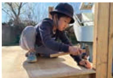
3歳児から行う、かなづちを使った活動。

天然芝の園庭、雑木林や800坪の丘など自然豊かな環境の中での体験を重視。五感を働かせ、感じ、考え、能動的に生きる力を育む。「いきる・つくる・たべる」を大事に、土から作る畑で育った野菜を自分たちで調理し、食べる。子どもとの対話を軸に「子どもとつくる保育」を実践。子どもの声から始まるプロジェクト活動(5才児)では、その年ならではの取り組みが毎年行われる。見学は随時。直接連絡を。