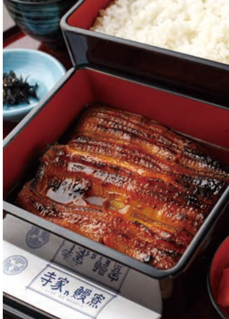
ふっくらした中に歯ごたえも感じられ、食べごたえのある「うな重(松)」。