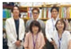
英語受験に強い進路指導室。

日本人であることを大切にしながら、使える英語を身につけられる英語イマージョン校です。しかし、ゴールは幸せに生きること。そのために必要な考え方やコミュニケーション力を身につけます。結果として自己肯定感が上がり、自ら学習し、学力もつきます。