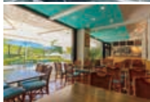
もっちりした食感のパンケーキ1,408円(上)。南国感あふれるお洒落な空間(下)。