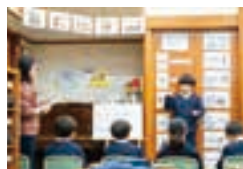
自学自律を目指した学びの実践。

創立者・小原國芳が日本で初めて提唱した「全人教育」の理念のもと、「きれいな心（徳育）」「よい頭（知育）」「つよい体（体育）」の玉川っ子を目指し、「人生の最も苦しいいやな辛い損な場面を真っ先に微笑みを以って担当せよ」という玉川モットーを今も大事にしています。